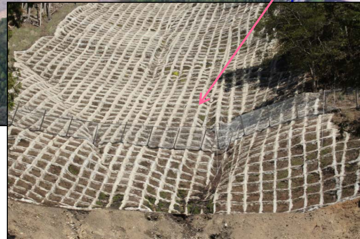
安全対策工 完成状況