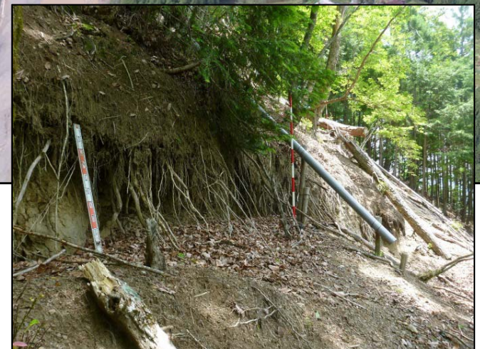
施工地内の地すべり亀裂状況