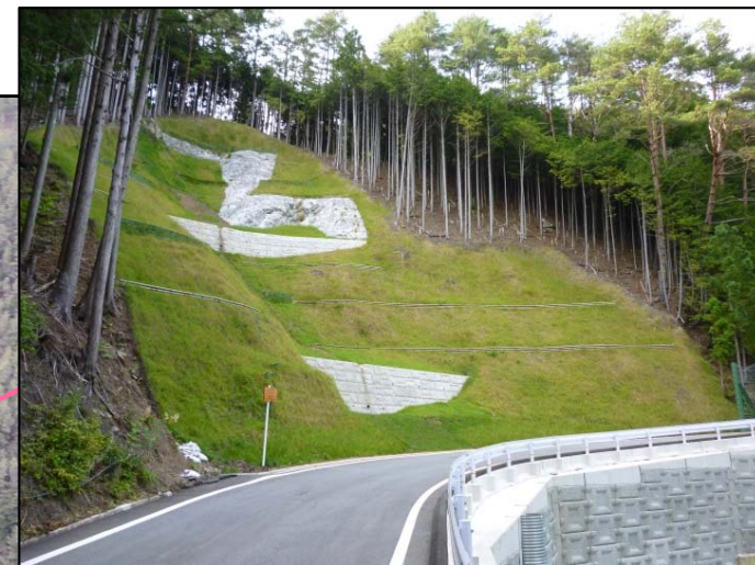
山腹工 完成状況 (村道上部)