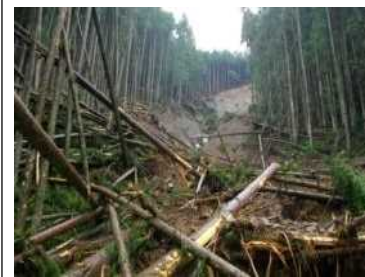
川合(深谷)工区 (被災直後) ・崩壊規模 0.54ha ・対策：山腹工 (平成25年度工事完了)