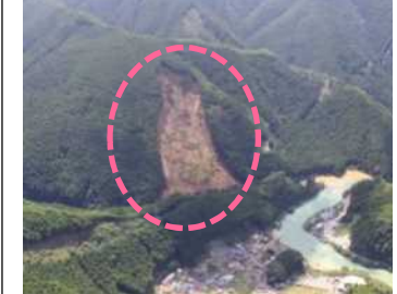
坪内工区 (被災直後) ・崩壊規模 3.65ha ・対策：床固工及び山腹工