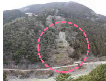
堂平工区 (被災直後) ・地すべり兆候の規 3.00ha ・対策：アンカー工 (令和3年度工事完了)