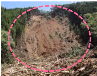
檜股工区 (被災直後) ・崩壊規模 1.56ha ・対策：谷止工及び山腹工 (令和3年度工事完了)