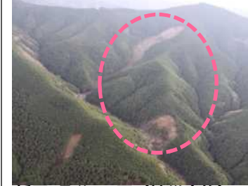
栃尾(桑谷)工区 (被災直後) ・崩壊規模 1.5ha ・対策：谷止工及び山腹工 (令和3年度工事完了)