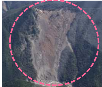
赤谷工区 (被災直後) ・崩壊規模 24.86ha ・対策：山腹工及び土留工