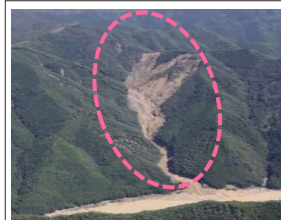
野尻工区(被災直後) ・崩壊規模 20.44ha ・対策：谷止工、山腹工