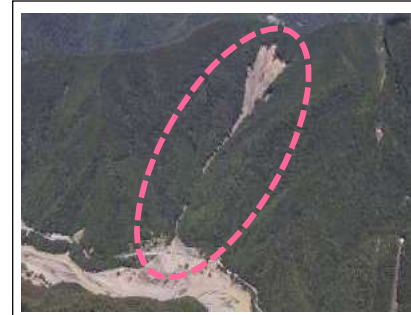
長殿(テラ谷)工区(被災直後) ・崩壊規模 2.75ha ・対策：谷止工、山腹工