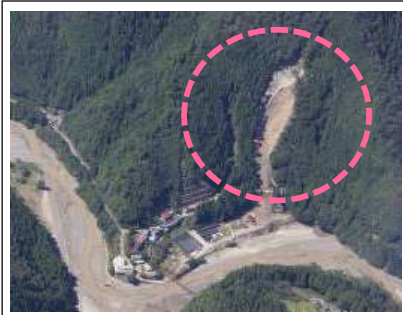
五百瀬工区(1号地)(被災直後) ・崩壊規模 0.47ha ・対策：山腹工 (令和4年度工事完了) ※今年度調査のみ