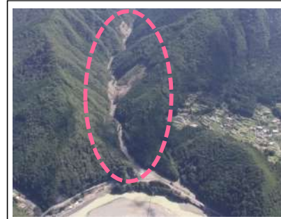
高津工区(被災直後) ・崩壊規模 2.67ha ・対策：谷止工、山腹工 (平成30年度工事完了)