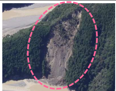
折立工区(被災直後) ・崩壊規模 2.36ha ・対策：山腹工 (平成27年度工事完了)