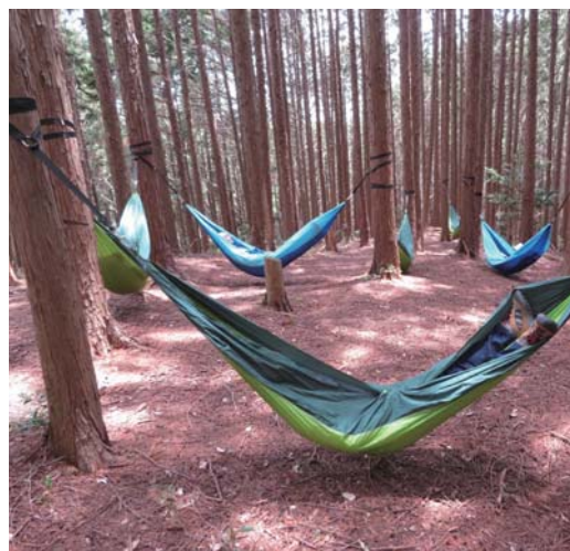
ハンモックに揺られてすやすや～☆