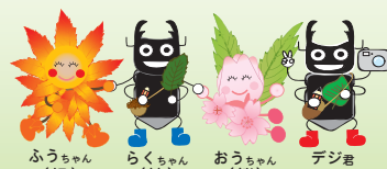
ふうちゃん(楓) らくちゃん(らく) おうちちゃん(桜) デジ君

林野庁 近畿中国森林管理局 箕面森林ふれあい推進センター TEL:050-3160-6745/FAX:06-6881-2055 〒530-0042 大阪市北区天満橋一丁目8-75 近畿中国森林管理局 3F URL: http://www.rinya.maff.go.jp/kinki/minoo_fc/ E-mail kc_fureai@maff.go.jp