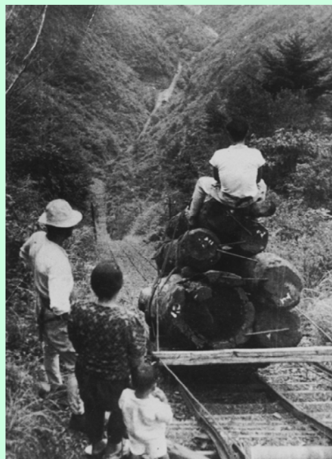
インクラインによる運材

その後、時代は移り、平成3年に、原始的な森林を後世に残していくため、大台ヶ原の北東側に位置する国有林、約1,400haを「大杉谷森林生態系保護地域」に指定しました。