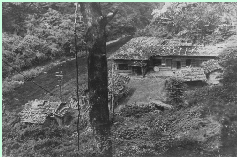
不動谷製品事業所（最盛期には70人ほどが生活）

また、運材事業についても、昭和6年に、木材を運び出すための大杉谷軌道に着手、その後も当時東洋一と伝えられる大杉谷索道、高低差を利用するインクラインなどの大掛かりな工事が始まり、昭和8年に、不動谷製品事業所の設置、昭和4年に、天然更新試験の開始、昭和12年に、パルプ製作工場が設置されました。