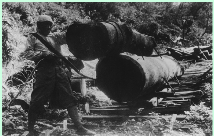
「土倉古道」を利用した木馬運材