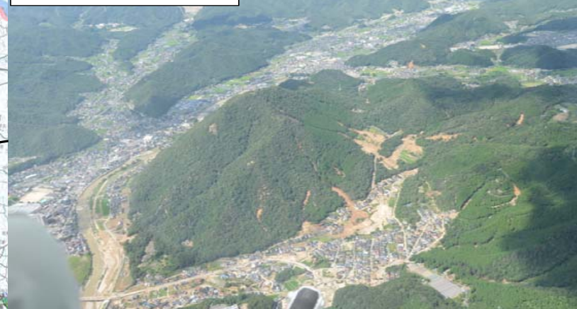
高松山国有林 31林班