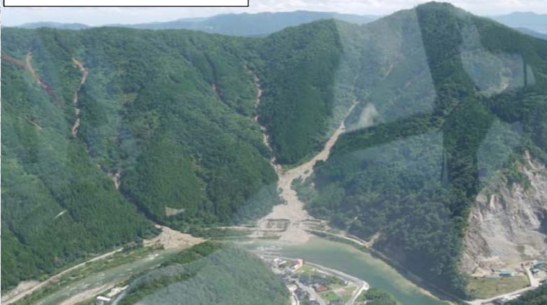
犬戻鳴山国有林 60林班