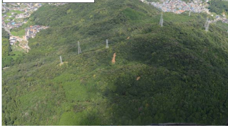
影浦山国有林 63林班