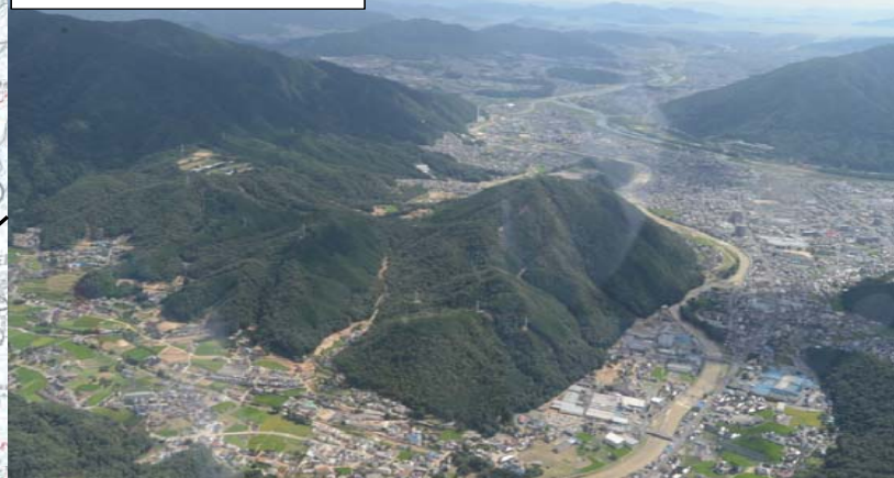
高松山国有林 31林班