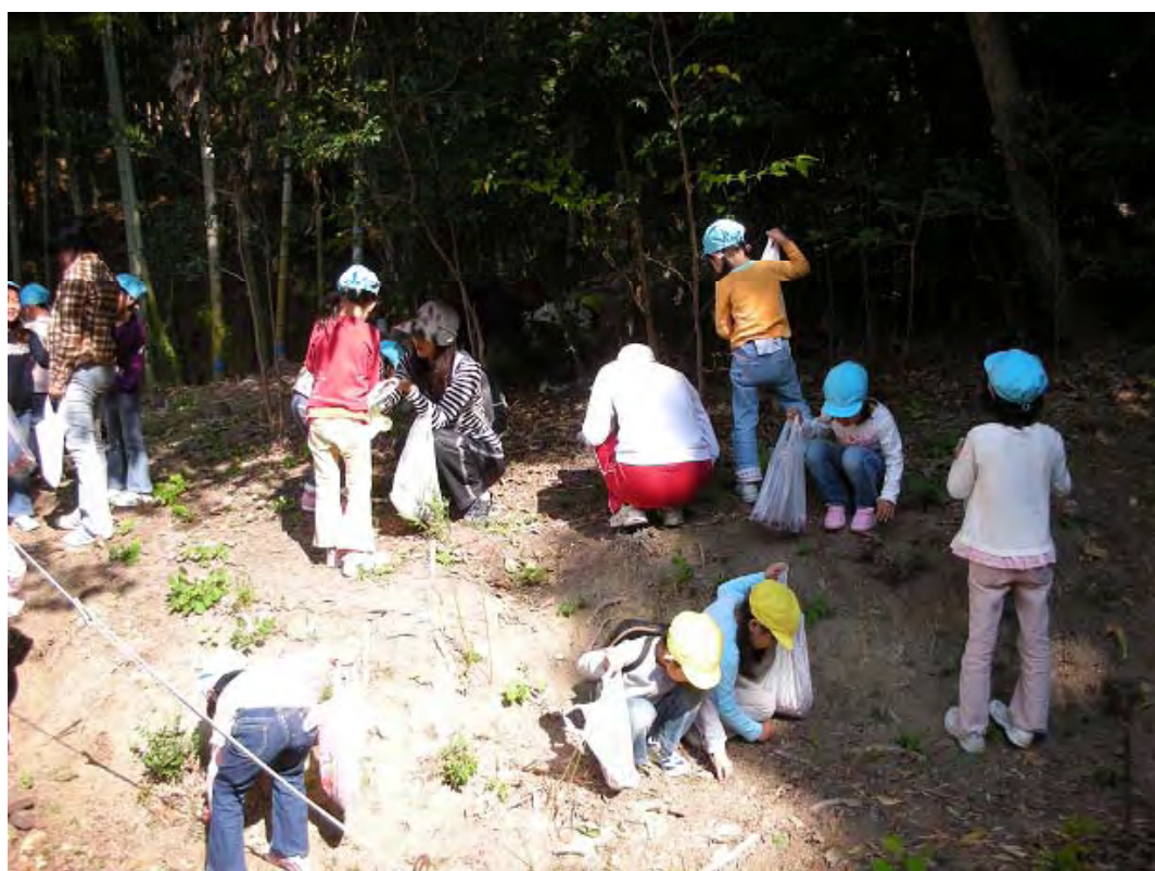
ドングリ拾いに熱中(箕面市立とよかわみなみ幼稚園児)(10月21日)