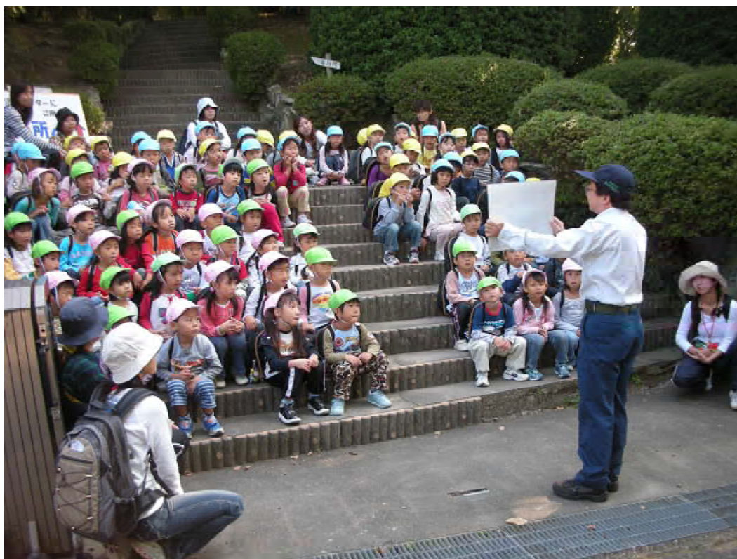
ドングリの話に興味津々(箕面市立とよかわみなみ幼稚園児)(10月21日)