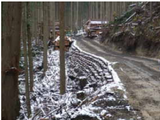
作業路網の整備状況