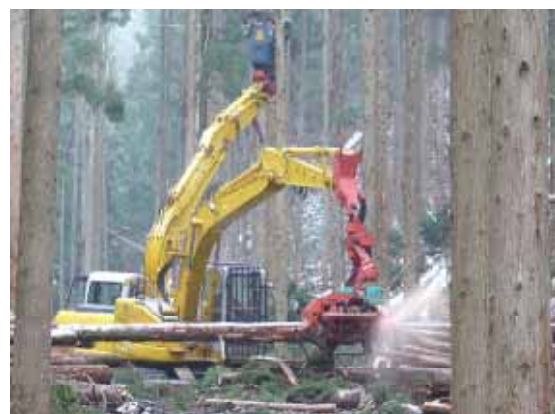
高性能林業機械による間伐材の生産