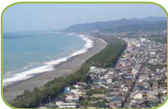
七里御浜国有林の海岸防災林

また、「吉野熊野国立公園」第1種特別地域、世界文化遺産「紀伊山地の霊場と参詣道」のバッファ地域となっているほか、レクリエーションの森に指定され、全国93箇所のひとつとして「日本美しい森 お薦め国有林」にも選ばれています。