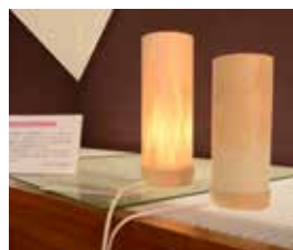
和紙と薄く剥いだヒノキの皮 で作られています