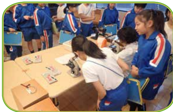
顕微鏡を覗き込む児童

ブロックを水に一斉に入れてみると、水に浮くブロックと沈むブロックがあり、木材が樹種によって重さが全く異なるのを知って歓声を上げて驚いていました。