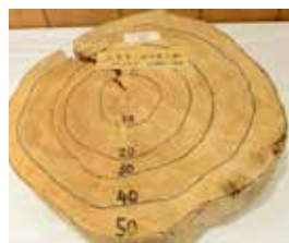
コウヨウザンの輪切り