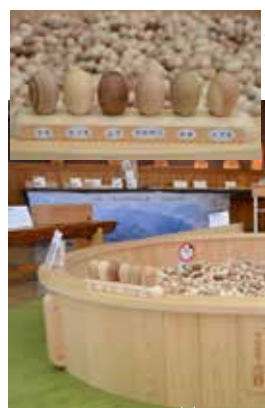
プールの中には卵の形をした 木が入っています