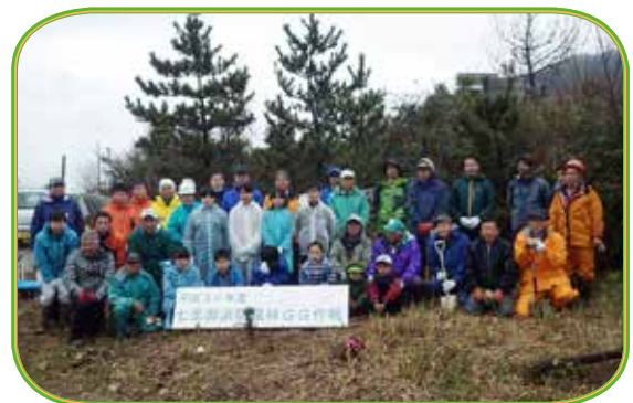
GGに参加されたみなさん（紀宝町）

三重森林管理署では、今後ともこの美しい七里御浜をしっかりと管理し、地域にとってより親しまれる国有林にしていきたいと考えています。