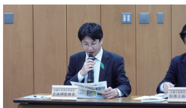
説明をする企画調整課長

記者発表では、能登半島地震による被害箇所の復旧をはじめとする国土強靱化への取組をはじめ、森林の持つ多面的機能の持続的な発揮に向けて、公益重視の管理