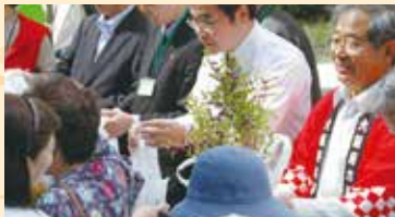
苗木プレゼント (数量限定、スタンプラリー制)