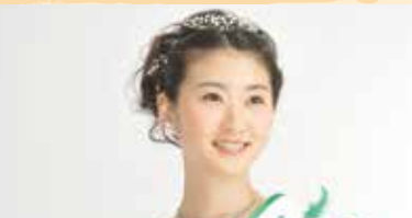
初代「ミス日本 みどりの女神」来場

会場: 近畿中国森林管理局・毛馬桜之宮公園 JR環状線「桜ノ宮駅」西口から徒歩5分