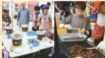
森の食材を活かしたフードコーナー