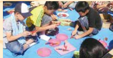
木と遊ぶキッズコーナー

主催: 水都おおさか森林づくり・木づかい実行委員会 協賛: 一般財団法人日本森林林業振興会大阪支部 / 一般社団法人全国燃料協会 後援: 国土交通省近畿地方整備局 / 近畿地方環境事務所 / 近畿農政局 / 三重県 / 滋賀県 / 京都府 / 奈良県 / 和歌山県 / 大阪市 / 大阪府 / 大阪府教育委員会 / 滋賀県森林組合連合会 / 京都府森林組合連合会 / 奈良県森林組合連合会 / 和歌山県森林組合連合会 / 滋賀県木材協会 / 一般社団法人京都府木材組合連合会 / 奈良県木材協同組合連合会 / 兵庫県木材業協同組合連合会 / 和歌山県木材協同組合連合会 / 内閣府公益社団法人大阪府猟友会 / 公益社団法人国土緑化推進機構 / 公益財団法人関西・大阪21世紀協会 / 公益財団法人国際花と緑の博覧会記念協会 / 帝国ホテル 大阪 / 産経新聞大阪本社 / 森林環境の保全・整備連絡調整会議