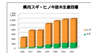
資料：第3回広島県地域林政連絡会議 「苗木生産目標」