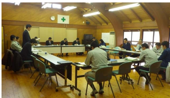
（計画案の地元関係者への合意形成の様子）