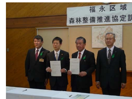
（協定締結調印式の様子）