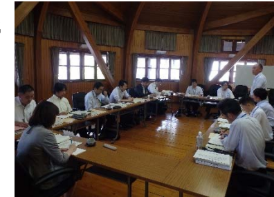
（広島県との地域林政連絡会議の様子）