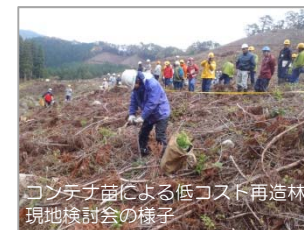
コンテナ苗による低コスト再造林 現地検討会の様子