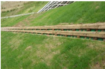
（治山工事への県産材利用の様子）