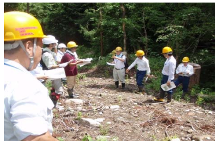
（一貫作業システム箇所現地視察の様子）