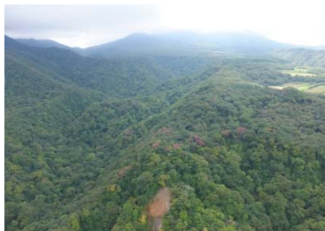
(大流国有林上空から撮影されたナラ枯れ被害)