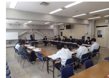
(治山砂防連絡調整会議の様子)