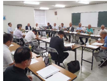
（猟友会との意見交換会の様子）