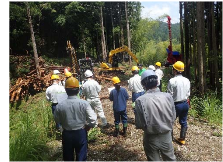
(鳥取県と民有林でのオーストリア製タワーヤーダによる集材の現地視察の様子)