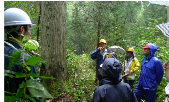
複層林施業を説明する様子