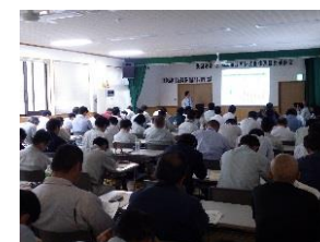
2000本植栽育林技術体系の普及研修会の様子