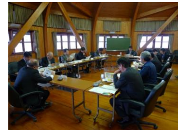
（広島県との地域林政連絡会議の様子）

▶ 国有林が所在する市町については、各種会議やアンケート等を活用した地域課題や共通課題の幅広い情報収集を行い、地域課題等の解決に向けて連携した取組を展開しています。平成28年度からは、神石高原町森林整備計画の実行監理支援として、広島県、国有林フォレスターが連携し、国有林を核とした民有林との森林施業の集約化を図る森林共同施業団地設定の取り組みを行いました。