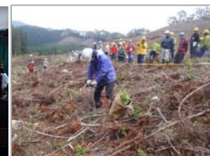
コンテナ苗による低コスト再造林現地検討会の様子