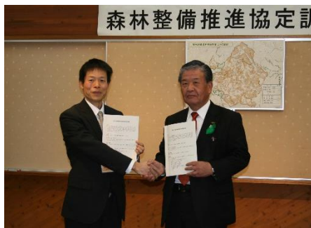
新たに設定した森林共同施業団地の協定調印の様子