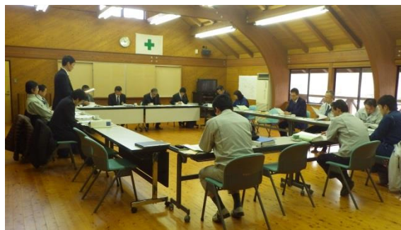
計画案の地元関係者への合意形成の様子