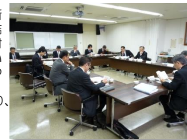
（バイオマス産業都市構想策定委員会の様子）