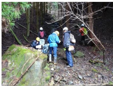
（現地踏査により路線を選定する様子）