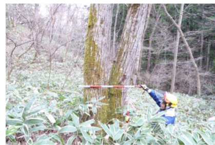
【釜谷国有林内広葉樹の様子】

このため岡山森林管理署では、里山広葉樹の家具や内装材等の用材等としての有効活用と天然下種更新による再生のためのモデル的取り組みを行う。