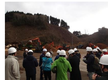
（真庭市内での木材利用研修の様子）