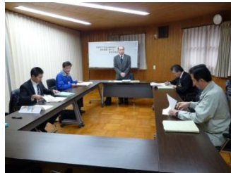
（28年度意見交換会の様子）