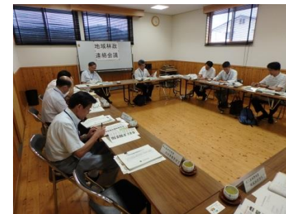
(岡山県との地域林政連絡会議の様子)

➤ 国有林が所在する津山市、新見市、真庭市、奈義町、鏡野町とも地域林政連絡会議を開催し、各市町の林業施策の概要、地域課題等について幅広く情報を共有し、意見交換を行いました。なお、それぞれの市町が抱えている地域課題については、事務担当者間により民国が連携した取組の検討を行い、それぞれの課題解決に向けた取組を展開しています。