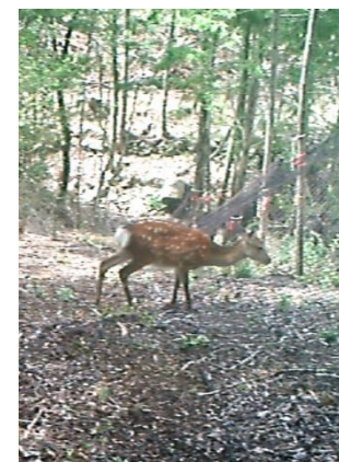
(斜め張り試験地の二ホンジカ)

• 鳥獣被害対策現地検討会等において、各地域における個体数管理の手法や広域連携の必要性等について理解を深めることができた。今後、効果的な防除対策に向け、市町村や関係団体等との連携も視野に取組を継続。