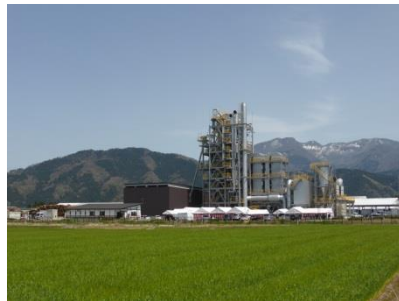
（木質バイオマス発電所）