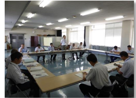
（福井県との地域林政連絡会議の様子）