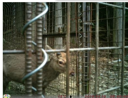
（捕獲されたニホンジカの様子：おおい町）