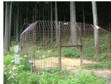
（罠の様子：おおい町）