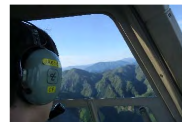
上空からの目視の様子