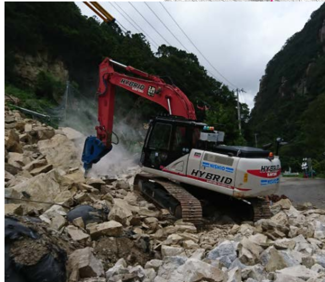
無人化施工により転石破碎（落石を砕く）