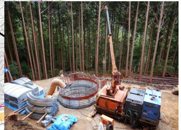
集水井工（地下水を排除するための井戸）