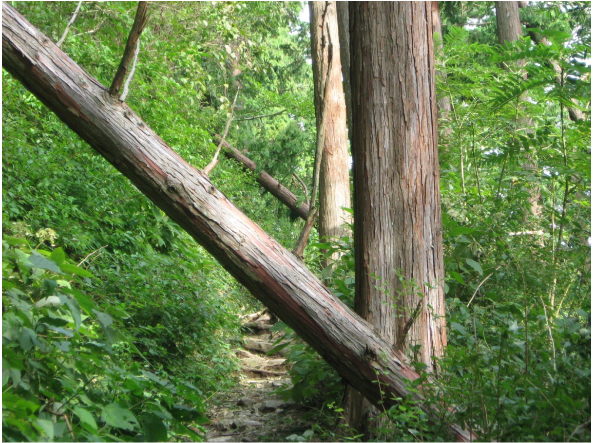
もみじ台南側の歩道