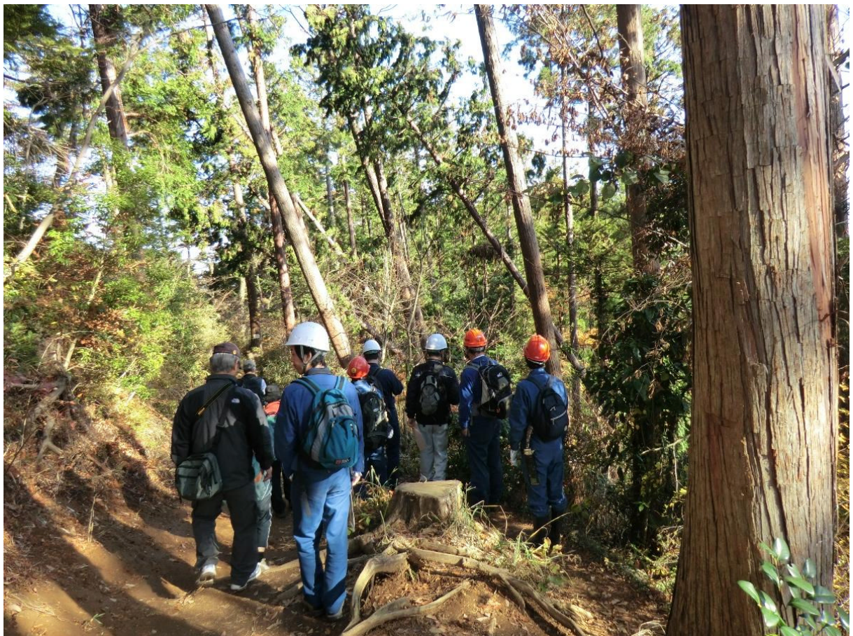
稲荷山コースの山頂付近