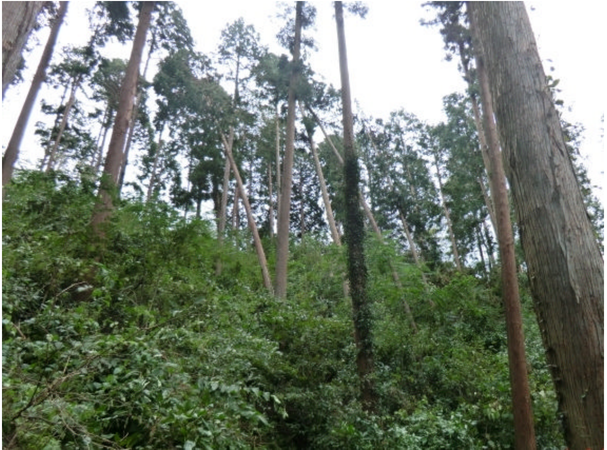
学習の歩道の上側