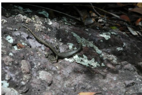
オガサワラトカゲ