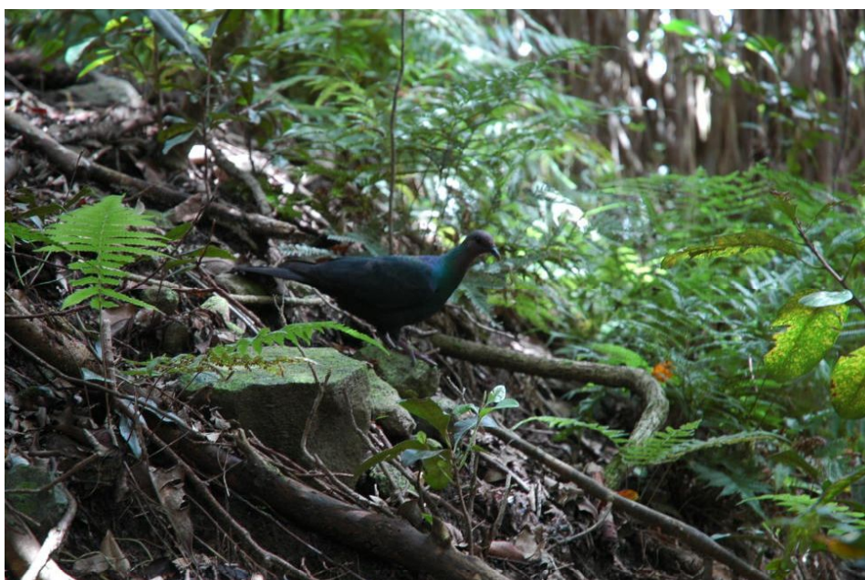
アカガシラカラスバト

一方、移入種として、ノヤギ、ノネコ、ノネズミ、グリーンアノール、ニューギニアヤリガタリクウズムシなどが生息しており、固有種等の生息に大きな影響を及ぼしています。