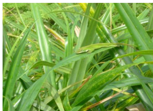
グリーンアノール