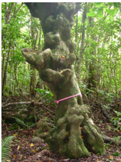
シマホルトノキ (コブノキ)

植物についても移入種の問題があり、特に、過去において薪炭用として移入したアカギ、モクマオウ等は固有植生に対する大きな脅威となっています。