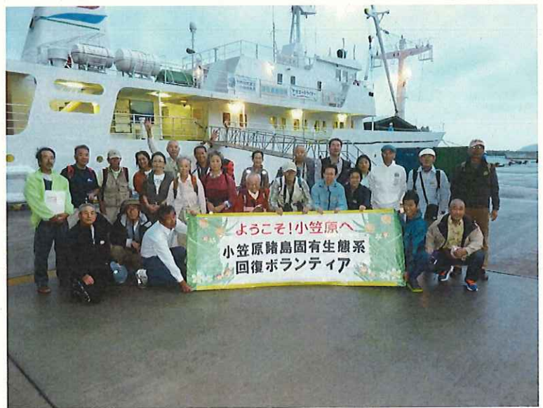
ははじま丸をバックに記念写真