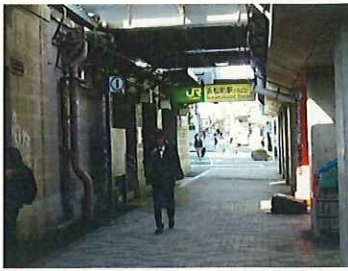
浜松町駅から竹芝へ