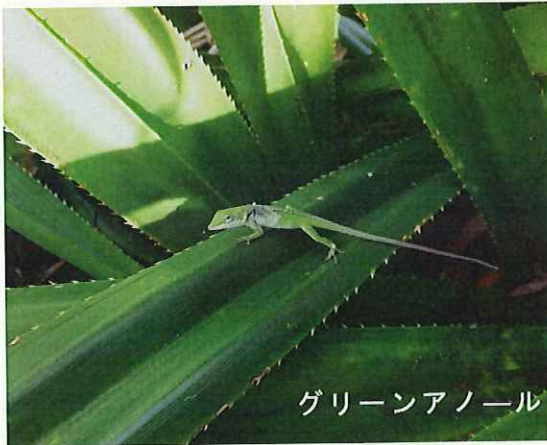
グリーンアノール