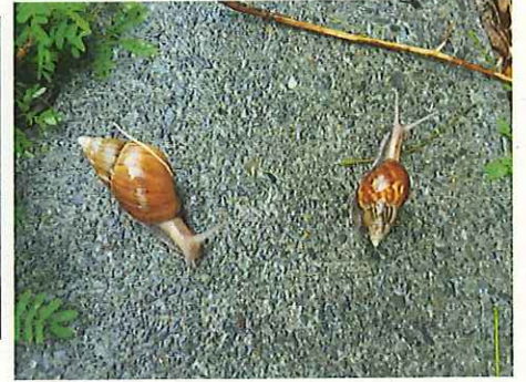
アフリカマイマイ