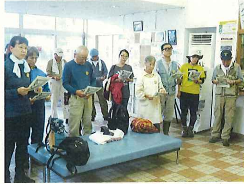
船客待合所で、作業前のミーティング