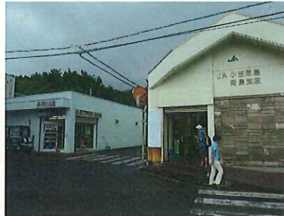
漁協と農協の売店