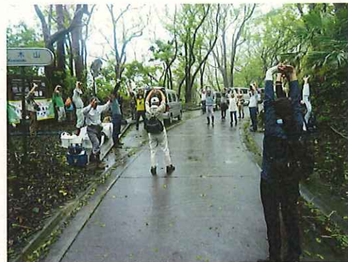
作業前の準備運動