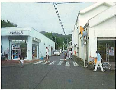
メインストリート