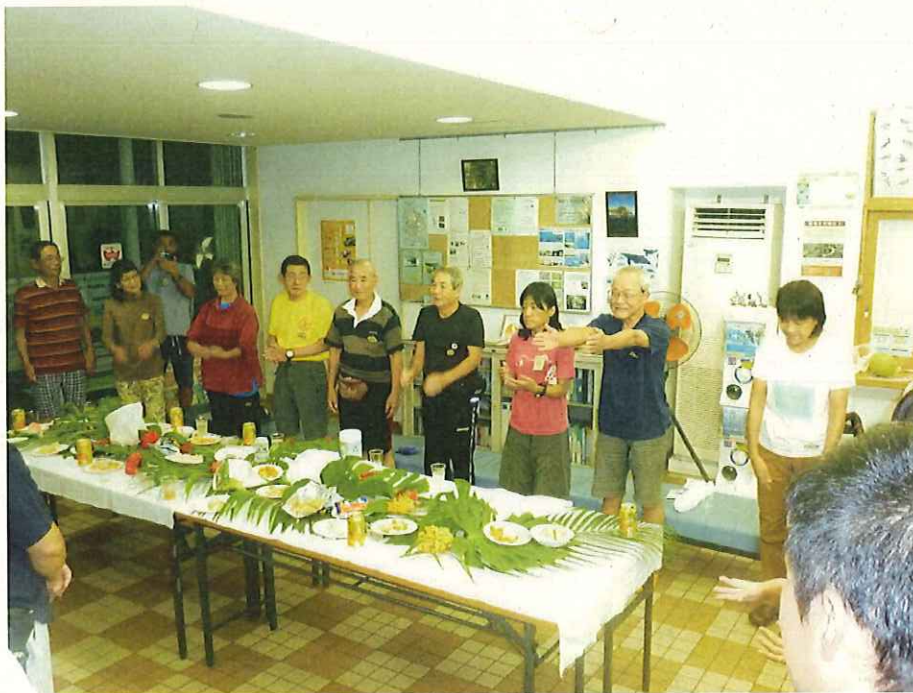
参加者のハーモニカ演奏