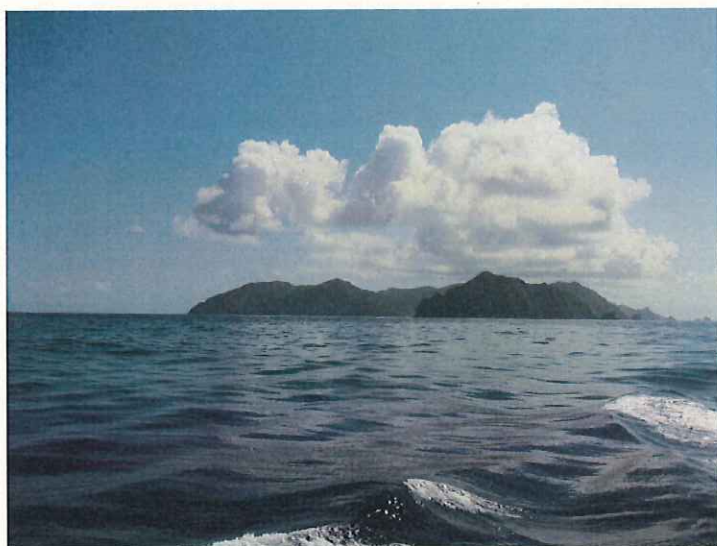
母島とお別れです