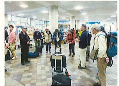
全員集合(乗船の説明)