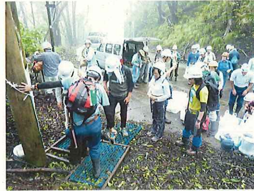
外来種対策もしっかり