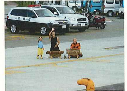
丸木太鼓で見送り