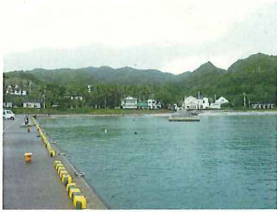
栈橋から大剣先山方面

○2015.10.27(火) 天候不順につきオプションツアー一日に変更、島内散策も