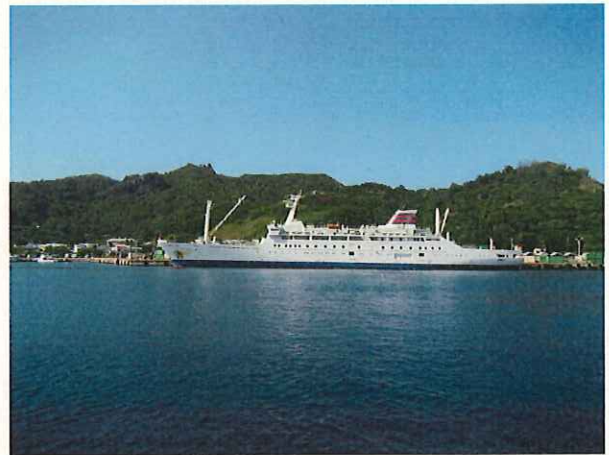
二見港のおがさわら丸