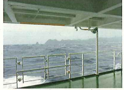
母島が見えてきました