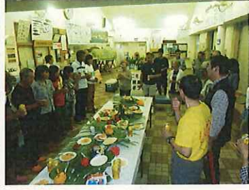
司会母島観光協会(茂木) 主催者挨拶(東京事務所) 平賀観光協会会長挨拶・乾杯