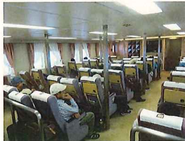
ははじま丸船内の様子