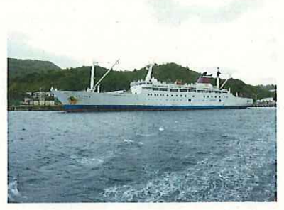
おが丸は着発で東京へ