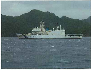
海上保安庁の巡視船みずほへり2機搭載