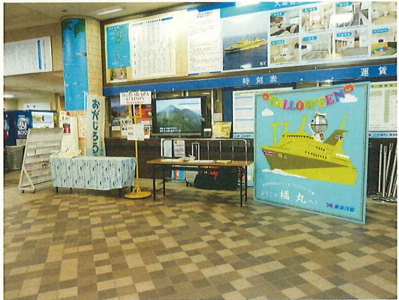
受付(竹芝船客待合所内)