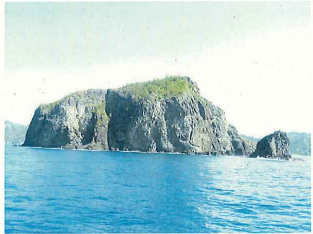
南島とハートロック