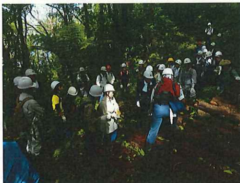
アカギ駆除の説明 (保全センター)