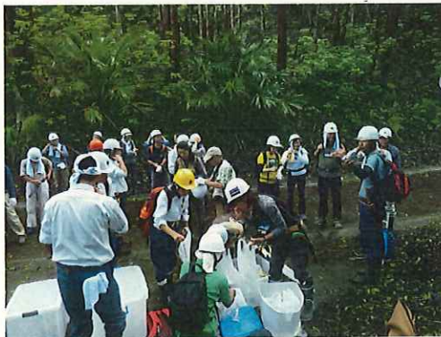
作業道具を揃えて