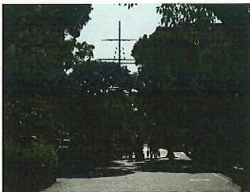
竹芝のマストが見えてきました