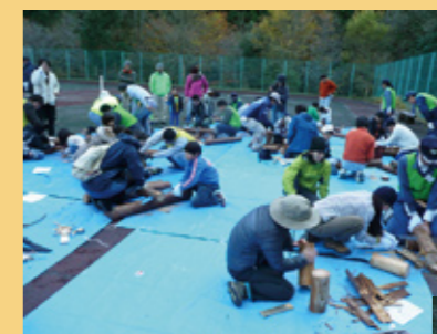
←ベンチ作りの様子。各グループごとに一つのベンチを作成しました。

完成したベンチと記念撮影。家族→で協力して物を作るという体験もなかなかよいですね。