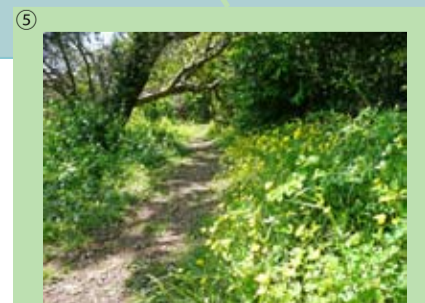
⑤ 弓張山系風景林 浜松市北区三ヶ日町、湖西市 152.26 ha