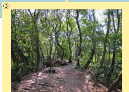
③ 小笠山自然観察教育林 掛川市 40.78 ha