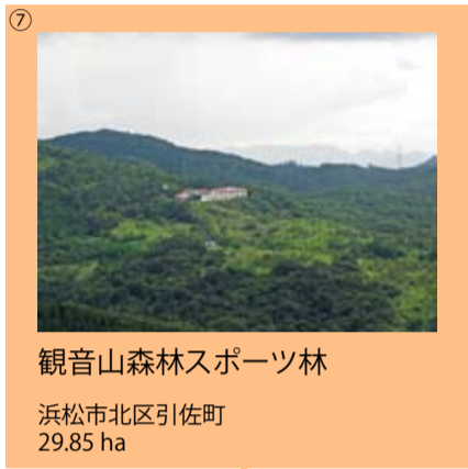
⑦ 観音山森林スポーツ林 浜松市北区引佐町 29.85 ha

レクリエーションの森は森林の特徴や利用目的により6種類に区分されており、天竜森林管理署管内にはその内の5種類、8箇所のレクリエーションの森があります。