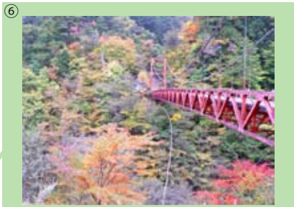
⑥ 白倉風景林 浜松市天竜区水窪町 54.14 ha