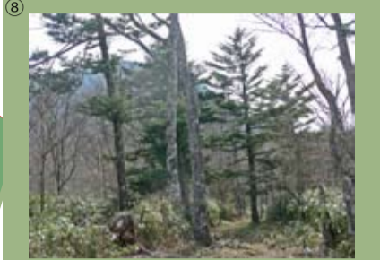
⑧ 千石平風致探勝林 浜松市天竜区春野町・水窪町、 榛原郡川根本町 368.11 ha