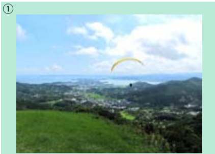
① 奥浜名自然休養林 浜松市北区引佐町・三ヶ日町 1112.41 ha