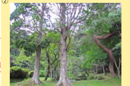
② 京丸自然観察教育林 浜松市天竜区春野町 5.21 ha