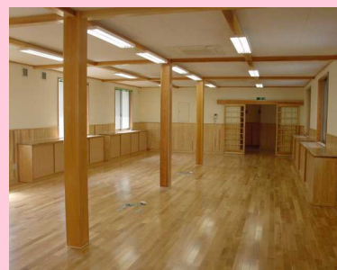
新築当時のセンター 庁舎内 (H19)

我が国の森林資源は、平成24年3月末現在で約49億m 3 の蓄積量があり、この半世紀で約2.6倍になっています。このうち人工林は約30億m 3 と6割を占め、収穫期を迎えています。森林資源を有効に活用するためにも国産材の利用を増やしたいものです。(木)