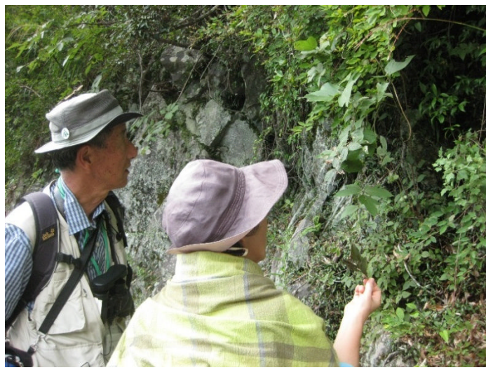
葉の付き方や葉の触感、匂いなどそれぞれの植物がもつ特徴に注目しながら観察しました。