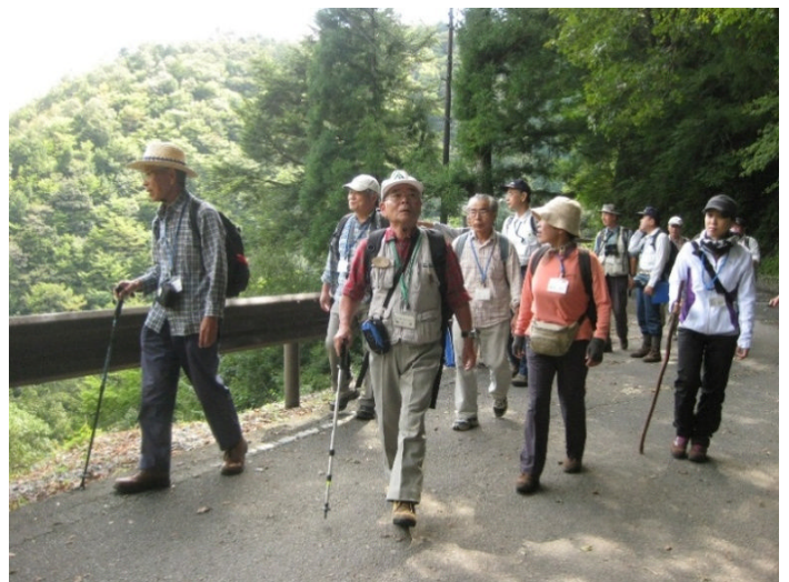
ゆっくりしたペースで観察