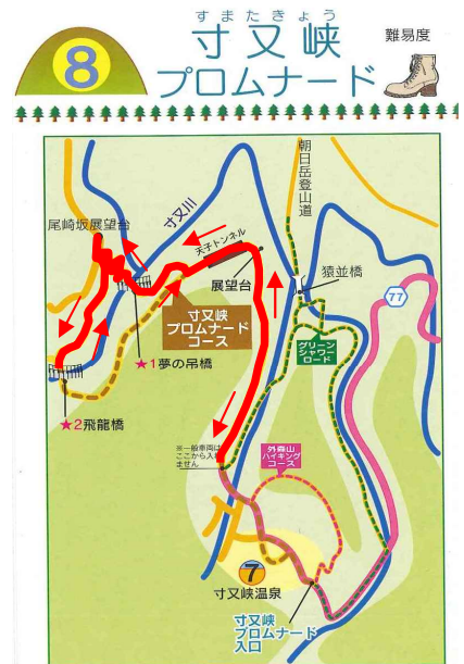
当日のコース(赤いライン)