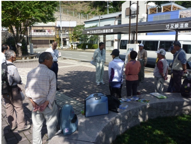
千頭駅前で開催の挨拶

昼食後には、展望台の中に展示されている森林鉄道を見学しながら、森林鉄道と千頭山国有林の歴史、また現在の国有林の取組について、理解していただきました。