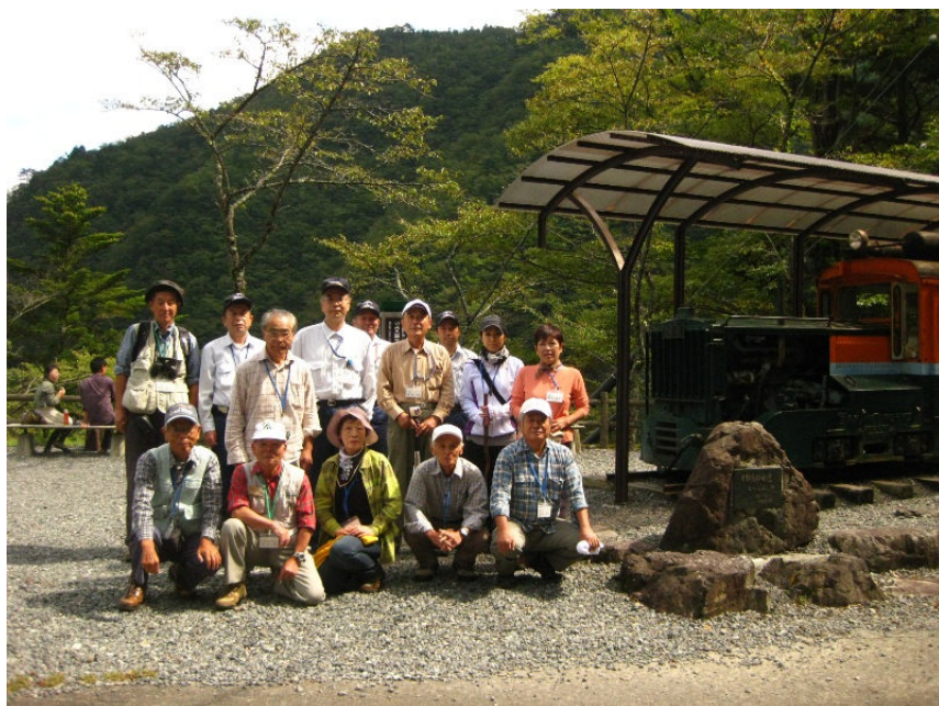
森林鉄道の前で記念写真(尾崎坂展望台)