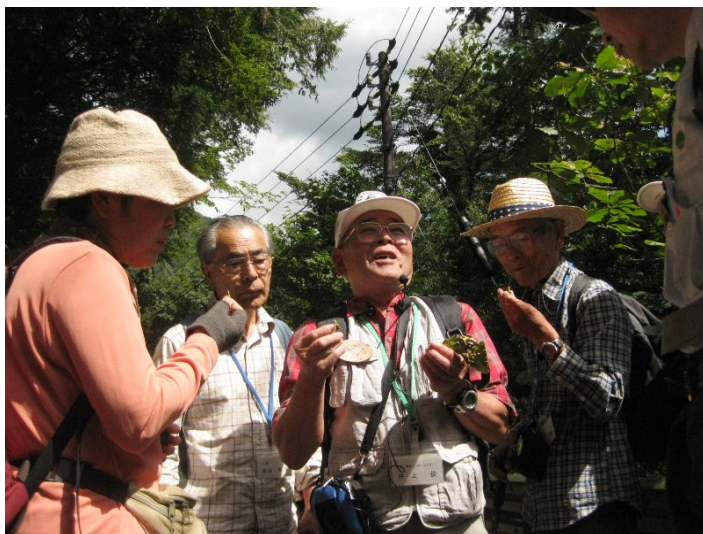
森林インストラクターの詳しく、楽しい解説