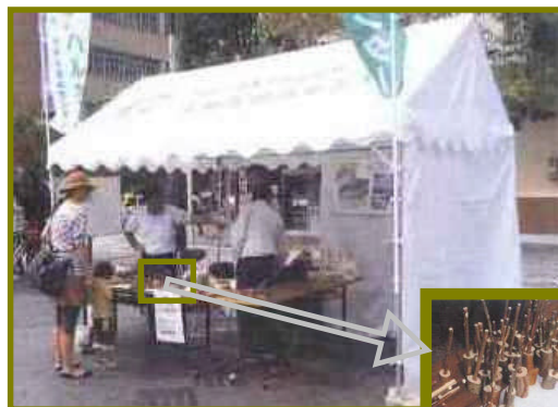
大井川治山センターのコーナー