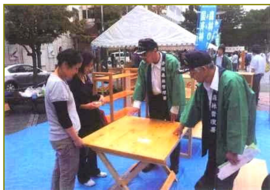
署長と次長がテーブルを紹介！