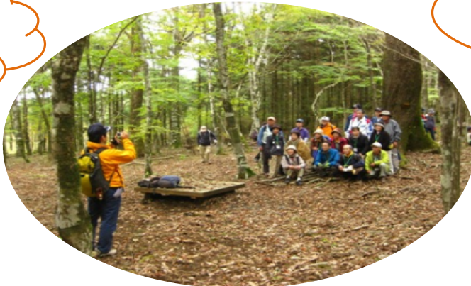
ナラ広場でちょっと休憩