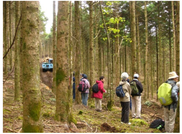
間伐材を運搬する作業車(フォワーダ)