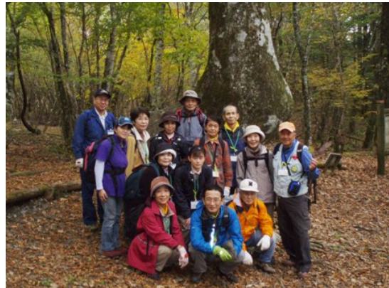
キノのようなかたちをしたフナに、おもわず笑顔