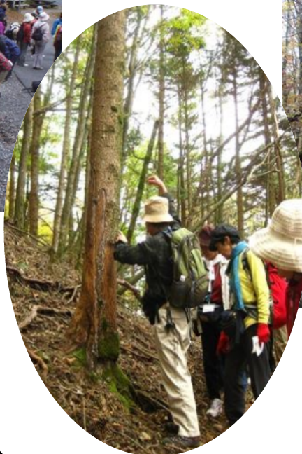
シカに樹皮を向かれたウラジロモミ