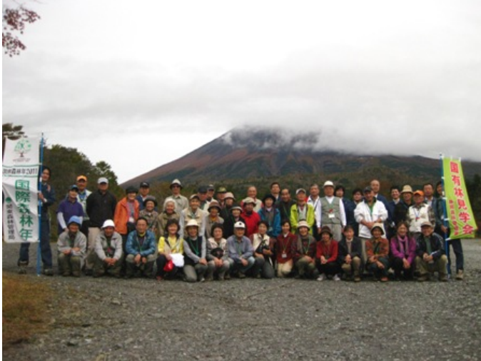
富士山を背景に記念写真

参加した方からは、「自然を満喫できた。」「間伐材の有効利用について取り組んでいる内容がわかった。」などの感想をいただきました。