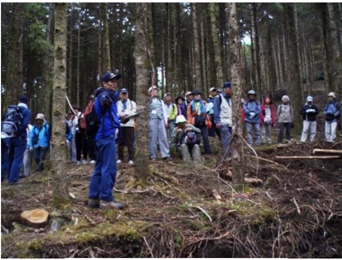
ウラジロモミの間伐事業箇所を見学