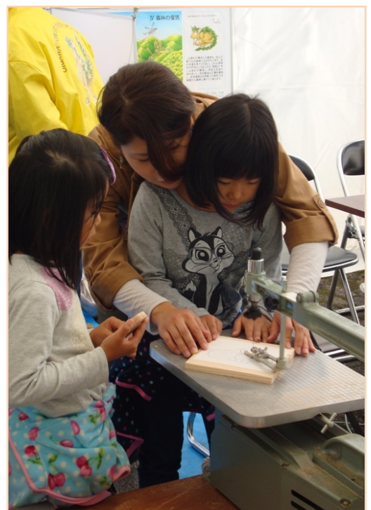
振動する板をお母さんがサポート