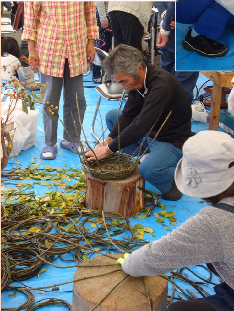
少しずつ立ち上げていくと、あともう少しで完成です