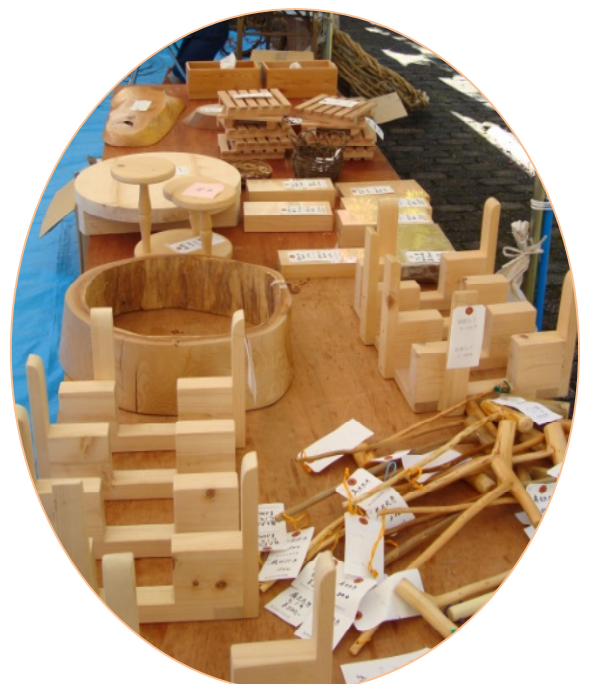
鍋敷きや新聞ラックなどの木製品の販売