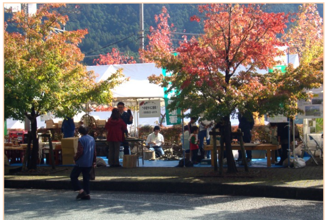
テント前のカエデが赤く色づいていました