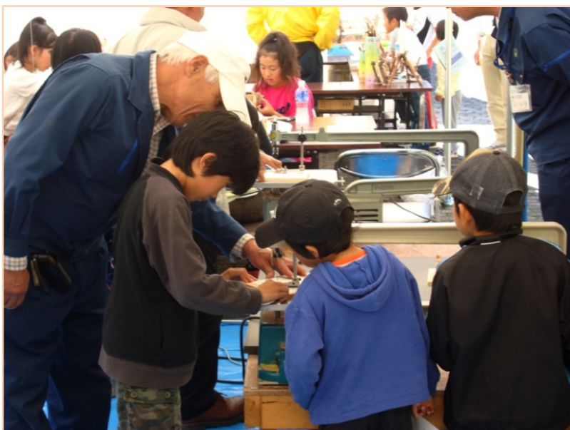
電動の糸/コギリでパズルを作ります