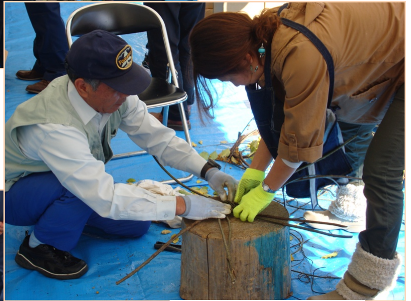
籠の底から編みはじめます