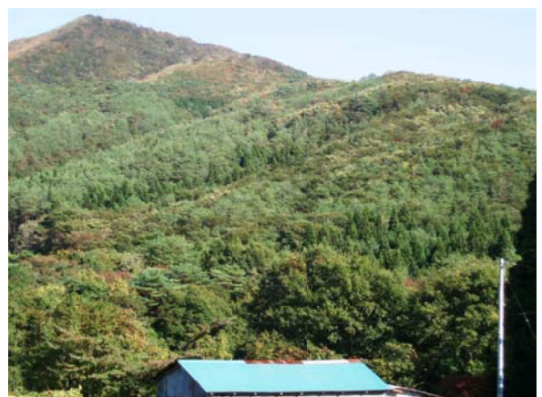
民家に隣接する国有林

当森林官になり3年目となりました。管内は、「民家のすぐ裏山が国有林」というほど近接しているため、国有林と地域の皆様とは密接な関係にあります。このようなことから、地元の人達の声聞きながら互いに支え合える関係を今後も続けていけるよう、森林官業務に奮闘していきたいと思っております。