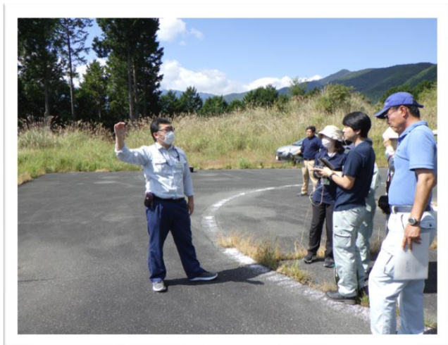
ドローン自動飛行操作説明

その後、OWLの有効活用(森林経営管理制度における意向調査時の活用)等について意見交換を行い、有意義な勉強会となりました。