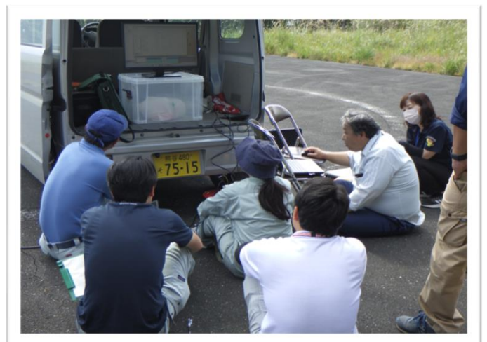
OWLデータ解析・説明