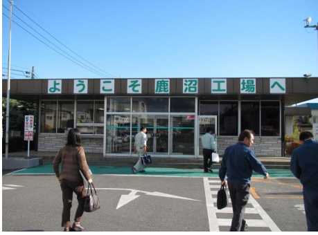
① 通信研修は9箇所の工場で行われます。今日はそのうちの1つ、栃木県鹿沼市にあるテクノウッドワークス(株)の工場にお邪魔しました。