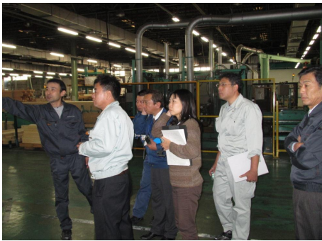
⑧ とにかく機械が多く、どのように動くのか説明がないと分かりません。流石は工場長、全ての機械を熟知されています。