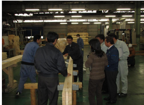
⑭ プレカット工場のほか、集成材工場、金物接合工場も見学しました。