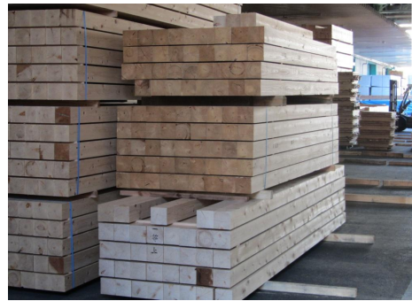
⑤ 広い工場なのですが、所狭しと材が集積されています。