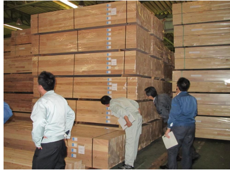
⑥ 材は用途別に、また、出荷先別にきちんと整理され集積されています。