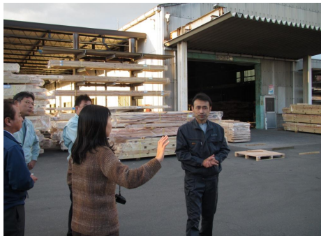
⑮ 研修生の様々な質問にも対応下さり、ありがとうございました。