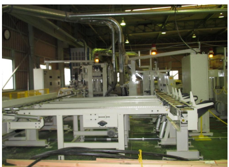
⑨ プレカットのラインです。