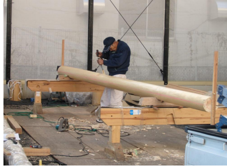
⑫ 熟達した技術も必要です。