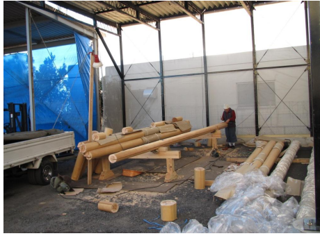
⑪ 全てが機械頼みではありません。