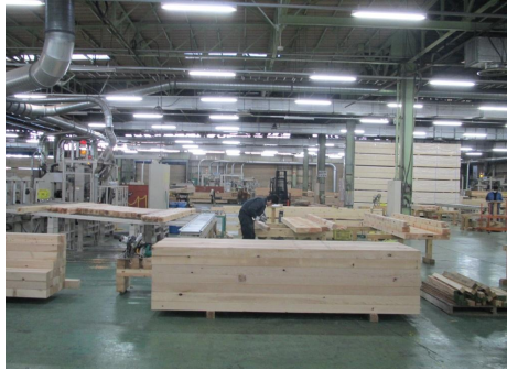
⑬ ハウスメーカーにより異なる要望にも対応できるよう、商品の企画段階から調整を進めます。