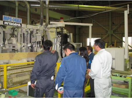
⑩ プレカット機械の説明です。コンピュータ端末と繋がっており、オートメーション化が進んでいます。