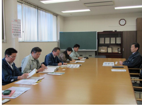
② 最初に会社の概要等について説明をしていただきました。