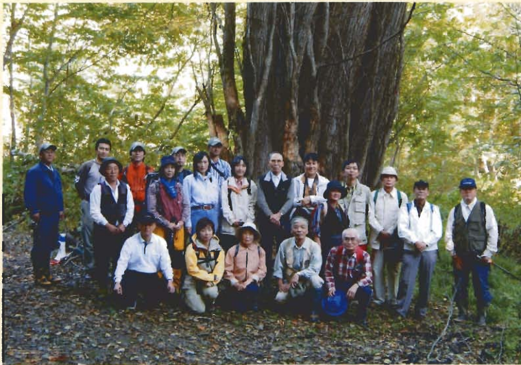
写真3) 赤谷の森自然散策集合写真(大カツラの前で)

●今後は、ムタ「沢」の自然観察会やボランティアでできる森林整備等のイベントの実施を予定しています。