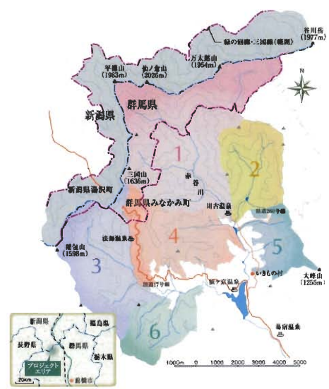
図1) 赤谷の森 エリア区分図

この「赤谷の森」と呼ばれているプロジェクト活動地域は、約1万ヘクタール（10km四方）の国有林で、6つのエリアに区分されています。（図1参照）