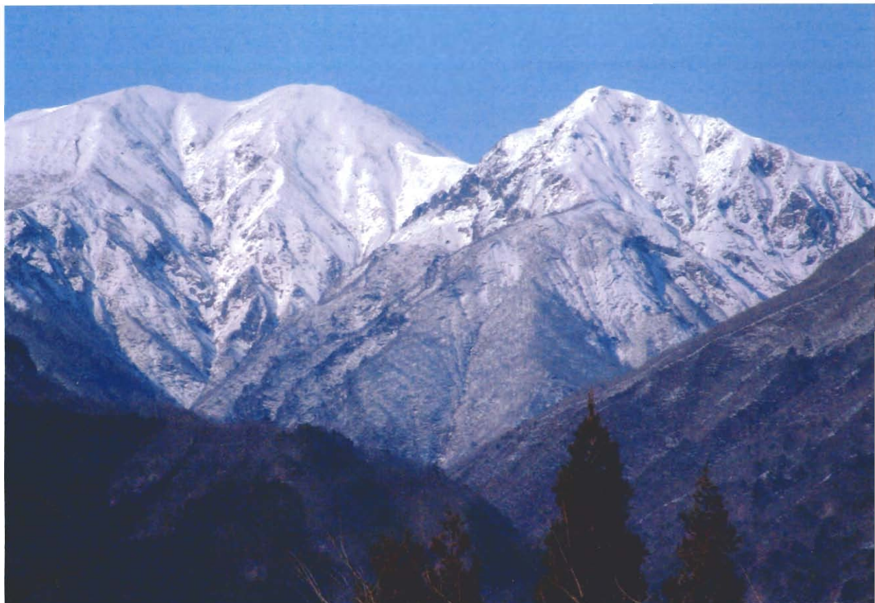
赤谷の森の最高峰 (仙ノ倉山)