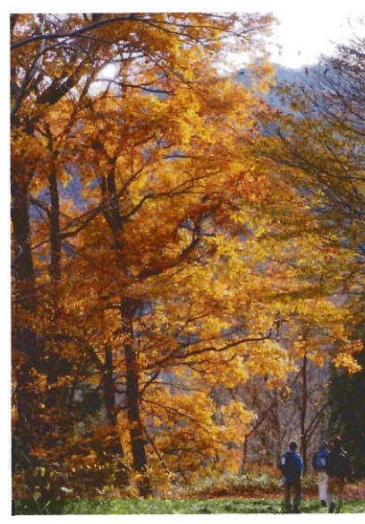
写真1) 小出俣エリアの紅葉風景

この2大目標に向けて、プロジェクトがまず取り組んでいることは、「赤谷の森」の現状について科学的根拠をもって調べる、と言うことです。調べていく内容は「赤谷の森」の植物のこと、動物のこと、自然環境のこと、あるいは「赤谷の森」の歴史についてなど多方面にわたっています。