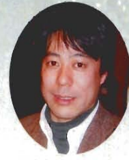
NPO利根川上下流連携 支援センター 副事務局長