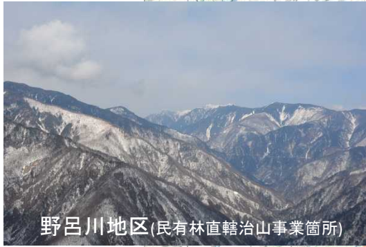
野呂川地区(民有林直轄治山事業箇所)