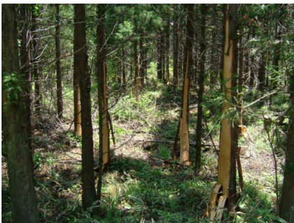
ツキノワグマによる剥皮被害

このように「美しい森林づくり」のための森林整備として、「百年先を見据えた森林づくり」に積極的に取り組んでまいります。