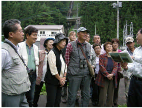
「協働」の取組に高い関心がありました。

今回、訪れるきっかけとなったのは、赤谷プロジェクトの自然環境モニタリング会議の専門家から紹介されたからとのこと、都市部の方々