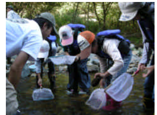
どんな虫がいるのかな？

その結果、カワゲラやトビケラの幼虫などの水生昆虫の他、トウホクサンショウウオやカミキリムシなどに寄生するハリガネムシも発見でき、カワガラスの飛来も確認できました。普段なじみが薄い川の生き物と接し子供たちは大喜びでした。今後もこのような機会を通じて、