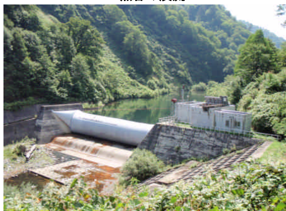
黒谷川本流の取水ダム(ゴムダム)

さらに、現在居住者がいる只見町太田地区の奥へ約7km入ったところには江戸時代中期に50～60年間木地師が暮らしていた布沢太田木地師集落跡があります。ここには屋敷跡、用水堀跡、土蔵石、精米に使用した石臼などが各所に残っており、当時の生活を知る貴重な遺跡として、只見町の文化財として保存されています。