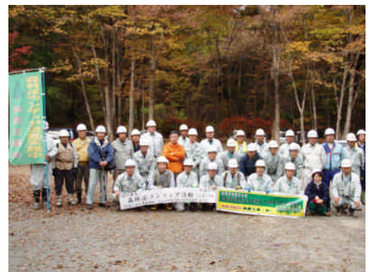
平成20年秋に実施した森林ボランティア活動参加者

に富んできている感じを受けます。毎回、作業終了後きれいな表情は、達成感と適度の疲労が相まって、ちょうどマラソンランナーがゴールした後の表情に似ていると感じます。