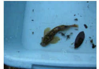
カジカも捕まえました。

地域住民の方々にも水と森林の関係について関心を高めていただければと願っています。