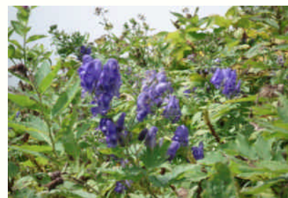
ミウコウトリカバ

発行所 関東森林管理局 編集 総務課 TEL (027) 210-1158 FAX (027) 210-1159