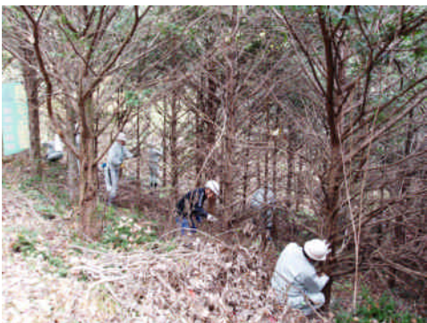
イチイ人工林の下枝伐り