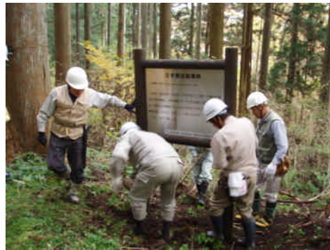
間伐指導林の標識設置

小根山森林公園の整備については、平成12年度の「ふれあいの森」が始まりで、平成17年度からは群馬森林管理署との新たな協定に基づいた森林整備を、年2回のペースで実施しております。