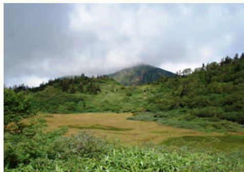
高谷池の草紅葉と火打山

火打山(2,462㍎)は、新潟県糸魚川市と妙高市にまたがる頸城三山の最高峰で、焼山(やけやま)、妙高山と並んで上信越高原国立公園内の名山です。