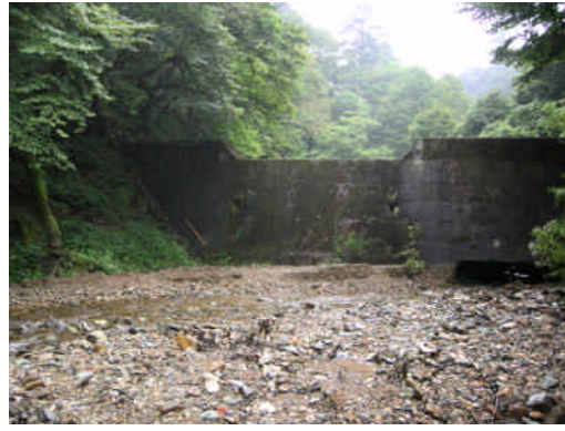
中央部撤去予定の治山ダム