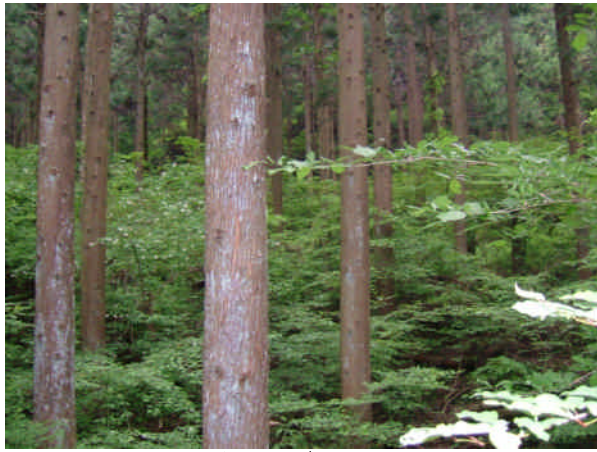
健全なスギの人工林

にこえる管理経営を目指して、本年4月、「森林の管理経営の指針」を改訂しました。この指針に基づき国有林野の森林整備について、「重点的に発揮させるべき機能発揮の観点から望ましい森林資源の状態を維持し、又はこれを誘導するため、個々の国有林野における林況や社会的要請等を踏まえて、伐採や造林の方法、施設の整備の内容を適切に選択し、きめ細かく実施する。」こととしました。