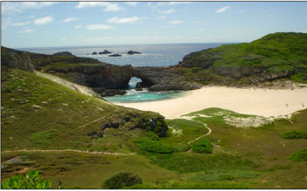
世界自然遺産に登録された小笠原諸島

また、野生鳥獣との共生を可能とする地域づくりに取り組むため、地方公共団体、NPO等と連携し、シカの食害による植生荒廃が発生している富士山、伊豆地域等において個体数管理に取り組むとともに、林業と生物多様性保全の両立を図るオオタカモデル森林でのモニタリング等の取組を積極的に進めます。