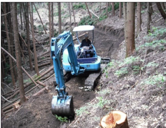
低コスト路網の作設の様子

また、大規模な山地災害時に適切に対応できる能力や、林業専用道作設など民有林への施業の低コスト高効率作業システムの普及等において指導的役割を果たす能力を有する専門技術者の育成に努めるなど、森林に関する技術者としての必要な知識や能力を養うとともに、民有林行政を支援することを念頭に、民有林の制度等に関する知識の習得が図られるよう研修内容の充実に努めます。