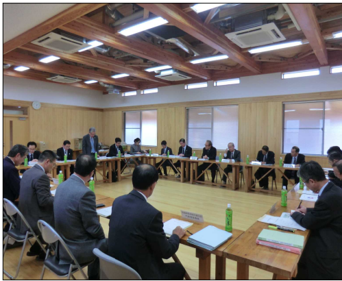
民国連携意見交換会の様子(茨城県)

間伐の推進等に積極的に取り組むとともに、森林・林業再生のため、流域森林・林業活性化協議会等に対して国の施策の紹介、民有林・国有林連携による取組の提案や、更には、局幹部と都県森林・林業関係者との意見交換を行う「民国連携意見交換会」を開催するなど国有林野事業に対する地域ニーズの把握に努めます。 また、流域管理システムの下で、安定的・計画的な木材供給、民有林・国有林一体となった森林施業、林業事業体の育成等の取組を着実に推進します。