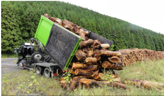
専用運搬車による林地残材搬出

また、間伐材等の安定供給と利用拡大を図るため、民有林との連携を図りつつ、システム販売による大口需要者への安定的な供給や、低質材や林地残材のバイオマス原料、石炭火力発電所での混焼利用など、販売の多様化に取り組めます。