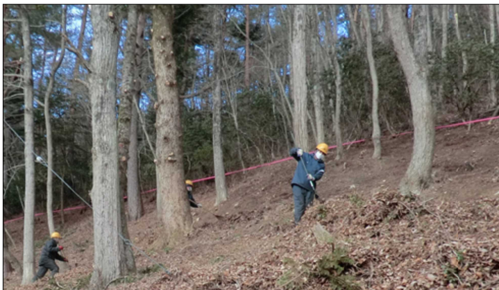
森林の除染(落葉等の堆積有機物の除去)

放射性物質に汚染された森林の除染については、新たに設置した森林放射性物質汚染対策センターを核として、関係市町村等と連携を図りながら国有林の森林除染を実施するとともに、除去土壌等の仮置場や除染技術の実証・研究開発等に係る国有林のフィールド提供等に積極的に対応します。