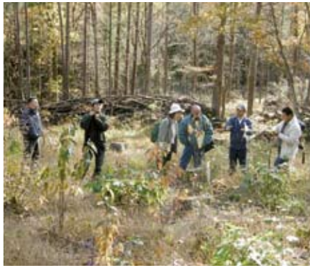
自然再生試験地で説明を受ける パナマ大学教授

また、地域住民への普及啓蒙という視点からは、赤谷プロジェクトの環境教育手法などと関係するところもあり、熱心に説明を聞かれています。