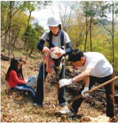
CSR活動による植樹の様子

企業が社会貢献の一環(CSR活動)として行う森林整備・保全活動に取り組み動きが益々盛んになる中、平成18年9月に新たな森林・林業基本計画が策定されるとともに、平成