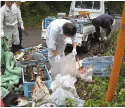
回収されたゴミの山