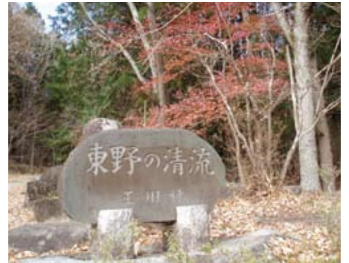
憩いの場として有名な「東野の清流」の碑

登山道入口から山頂までは約1時間登ることができ、山頂からは東には太平洋、西には那須連峰を望むことができることから、村民はもちろんな多くの登山家にも愛されています。