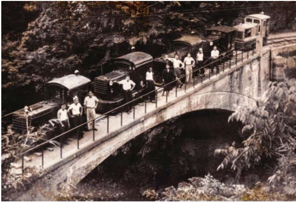
最後の機関車購入記念 (昭和27年4月撮影)

旧気田営林署部内に2路線あった内の1路線気多森林鉄道は、当時、静岡県周智郡春野町を流れる天竜川の支流気田川沿いの気田集落のはずれの篠原地区にあった篠原貯木場を起点とし、気田川に沿って、植田、勝坂を経て都沢に達する本線延長33 キロメートル であった。