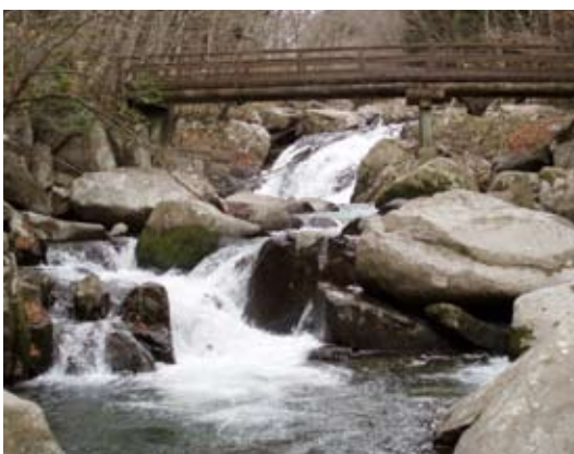
遊歩道にある山鶏滝

自分の仕事が数十年後、数百年後に感謝して頂けるように、これからも勉強を続けながら仕事をしていきたいと思っています。