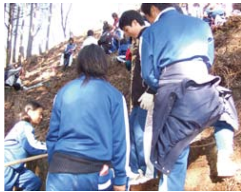
「立派に育ってほしい」との願いをこめて植樹

今回で3回目となるもので、過去2回についても、市内中学生や農工商科高校生による植樹を実施しました。