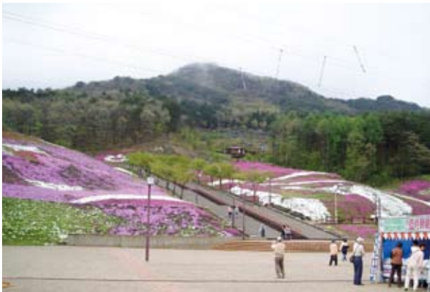
ジュピアランドひらたと蓬田岳

東北百名山のひとつ『蓬田岳(標高952メートル)』は平田村のシンボルとされています。