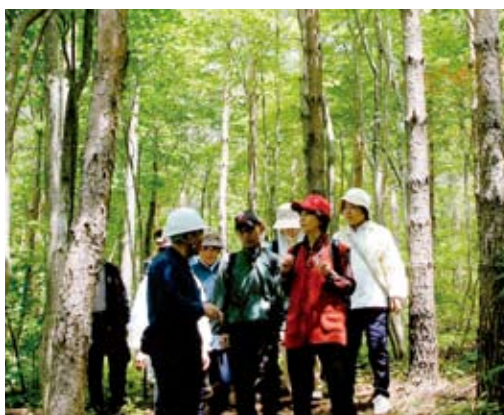
民友の森での活動の様子

平成16年度から、福島市内の国有林に設定した遊々の森「民友の森」において、毎年六回程度、新聞による公募と地域の教育関係者との連携により、毎回、30〜50名が参加し、ハイキング、木炭の勉強会、木工教室、自然観察会、森林内のクリーン活動等多様な取組を実施しています。