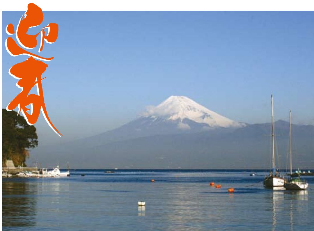
富士山（駿河湾より望む）