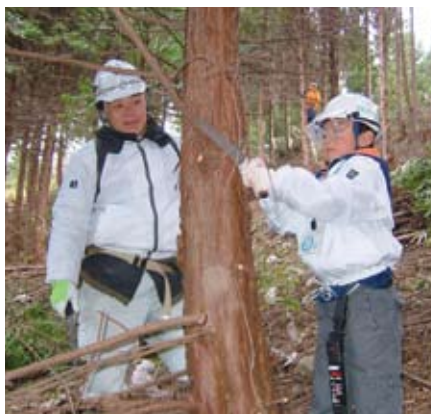
楽しそうにノコを引く子供

9班に分かれ各リーダーの指示に従い、ノコの使い方などの指導を受けながら、ヒノキの人工林箇所、枯枝払いや除伐等の作業を行い、心地よい汗を流していました。 最後に、大間々林業社員がチェーンソーによる伐倒作業を実演すると、参加者は木の倒れる様子を見て「オー」と歓声をあげていました。 午後からは、3班に分かれ、同友好の森に隣接する「天然水の森 赤城(法人の森林)」内の遊歩道を歩きながら森林教室が行われ、森林インストラクターからの樹木名や由来等の話に参加者は熱心に聞き入っていました。参加者からは、口々に「来年も是非参加したい」との声が聞かれました。 当署としても、森林に対する理解を深めていただけるよう、技術指導など積極的に対応していくことにしています。(流域調整官 大滝芳廣)