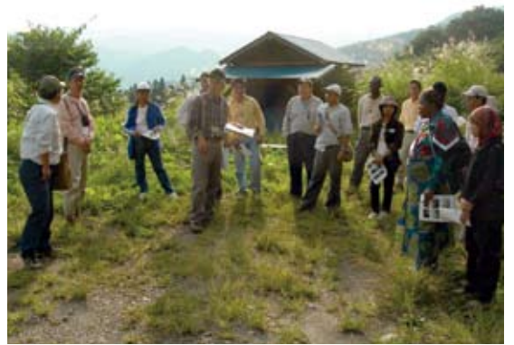
いきもの村での現地研修

担当者からは日本における赤谷プロジェクトの位置付けや、生物多様性をめぐる日本の状況などの講義がありました。