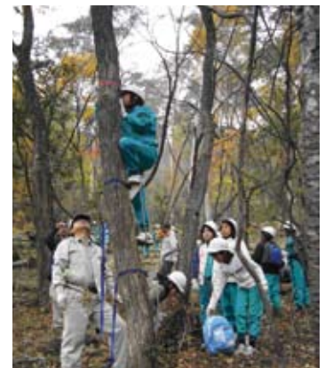
木登りも上手になりました

特に「木の気持ち(簡易木登り)」ゲームは、山仕事道具(スーパーステップ)を使って木に登り、一番上でシャボン玉を飛ばして風を目で確かめるものでしたが、初めのうちは怖