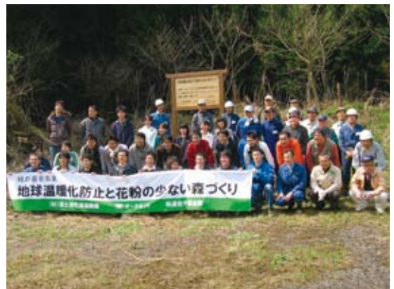
オークネットの森に参加した皆さん

この森林は、千葉森林管理事務所と(社)国土緑化推進機構との間でボランティアの森(「オークネットの森」として設定されました。