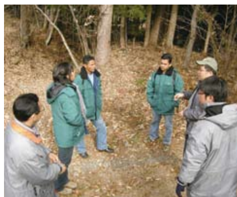
ブラジル人研修生と 県職員

この森林を地域の住民やNGOと連携して管理しようという取組を群馬県が支援しています。研修に訪れたのは、地元のNGO関係者と地元農家の2名です。若いブラジル人の2人でしたが、プロジェクトの運営資金についてや地域住民の参加についてなど真剣に話を聞いていました。