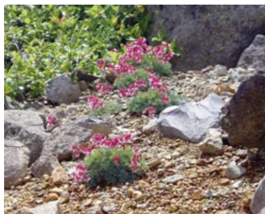
高山植物の女王「コマクサ」