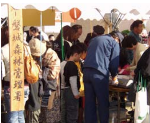
「モックン」作りに夢中の子供たち

子供たちが木に直接触れる機会が少ない現在、産業祭への出展を通じて、僅かの時間を提供できたと考えており、今後とも、こうした森林環境教育に積極的に取り組んでいくこととされています。