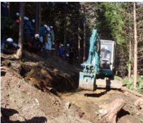
作業道作りの研修会

関東森林管理局では、このような自然環境なども含めたそれぞれの森林の現場の状況にもっとも適合した「幹」「枝葉」の「森林の道」を適切に組み合わせた路網整備を引き続き着実に推進していくこととしています。 (森林整備課)