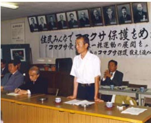
コマクサ復元の設立総会

今、「癒しの森」という言葉が活発に交わされる時代となり、人々は森を愛し、森と親しみ、自らの健康を森に求めるようになった。 そして今、私たちの町も「癒しの