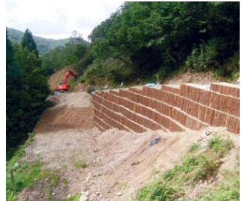
間伐材を利用した道づくり