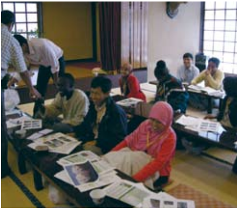
JICA海外技術室内研修