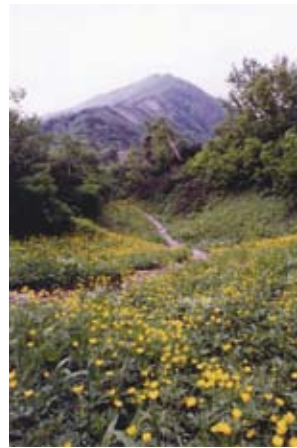
南アルプス登山にいろどりを添えるお花畑

「特定国内希少種」に指定され、保護区が設けられている。登山者の踏み荒らしや盗掘などで数が減ったとみられている。