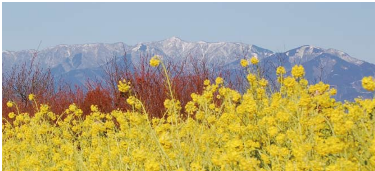
菜の花と丹沢山塊（神奈川県二宮町）