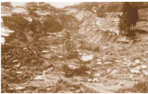
融雪により発生した大規模な地すべり

この写真は、昭和60年3月の融雪時期に、安塚町袖牧地区(現上越市)において発生した大規模な地すべりにより、30万立方メートルの土砂が滑動し、その崩壊土砂が約100メートル下流まで達した際に撮影されたものです。