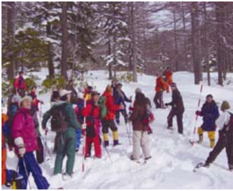
スノーシューを履いて見学する参加者

ここは吾妻森林管理署が管理する熊四郎山国有林で、平成20年度に樹立される吾妻地域の森林計画で「万座天然カラマツ植物群落保護林」として設定予定です。貴重な天然カラマツを保護するとともに、母樹林としても活躍したカラマツ大径木が多数存在し、その姿は冬の青空に聳え勇壮で威厳の風情を漂わせています。この保護林の設定を機会に、多く