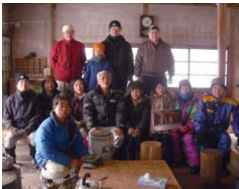
寒い一日にもかかわらず、熱気のある参加者の皆さん

当日は、雪が降っている中での開催のため、雪原に残るフィールドサイン(動物の足跡)などは観察できませんでしたが、普段、あまり関心が持たれることが少ない冬芽について、とても詳しい勉強をすることが出来ました。