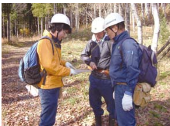
現地で打合せをする森林官 (左側)

また、森林官になってからは人と接する機会が格段に増え、様々な方達と国有林の在り方や森林へのアドバースを受けるなど情報を交換しています。