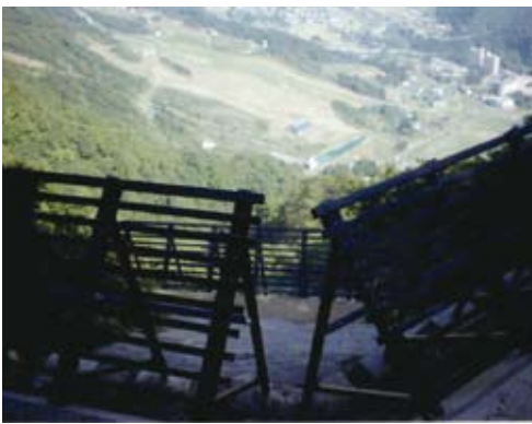
防災林造成事業（なだれ防止柵工） 新潟県塩沢町

これは、平成14年の台風6号及び21号の集中豪雨によって多量の土石が流下し、今後の豪雨等により土石