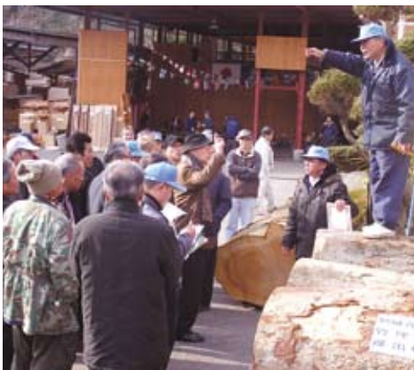
大盛況でのケヤキの競り