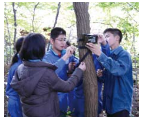
どんな動物が写るのか、想像しながら設置しています

た狭い範囲の調査にはとても有効ですが、森林全体のことを調べる際にはカメラの特性を考慮して行う必要があります。