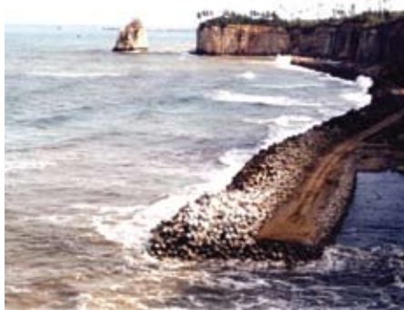
防災林造成事業 (消波堤) 福島県富岡町

など特に重要な機能を持つ森林については、森林法に基づいて保安林に指定し、その働きができるように森林の取り扱い方法を定めています。