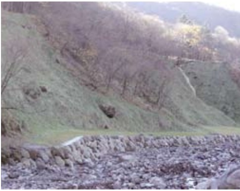
特定流域総合治山事業 (山腹工) 群馬県桐生市

森林は木材を供給するだけでなく、水をはぐくみ災害を防ぎ、心に安らぎを与えるなど、多様な働きを持っています。これらのうち、水源のかん養、災害の防備、生活環境の保全・形成