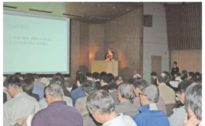
講演会を真剣に聞きいる聴講者