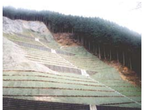
復旧治山事業 (山腹工) 栃木県日光市

流等山地災害の発生が危惧されることから、群馬県と連携して国有林においては崩壊斜面に山腹工等を、民有林においては治山ダムを計画し、現存する不安定土砂の流出防止対策を進めているものです。