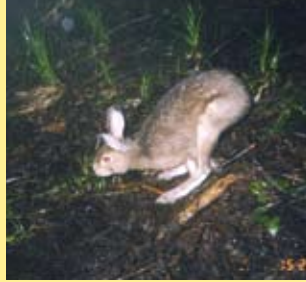
間伐試験地で撮影 されたノウサギ