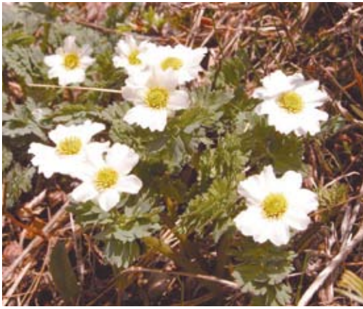
北岳のキタダケソウ

中高熟年登山者の「百名山制覇」への関心は相変わらずである。ブームの先導を大手全国紙と、同じく全国区の放送局が担っている現実を、同じ業界に身を置く人間として、また岳人の一人としていささか忸怩たる思いで見ている。