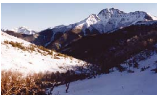
三伏峠から望む厳冬の塩見岳

「百名山を利用するのはもう止めよう」——。そう訴えたい。著名人とはいえ、所詮は他人が決めた価値。そんなものに振り回されず、自らの価値観を大事にした山登りをしようではありませんか。深田はさらに、こんなことも言っている。「私の求めるのは非流行の山である」——。