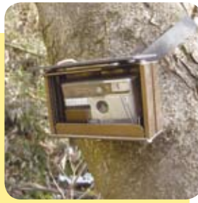
フィルム式 センサーカメラ

1つめは、調査・研究を目的として使用しています。間伐箇所など植生試験地において動物相の変化を調査したり、人工林と天然林での動物分布の比較調査、あるいは動物の習性を調べるために用いています。しかし、カメラの検出距離が4〜5メートルであることから、例えば「ある水場を使っている動物を調べる」といつ