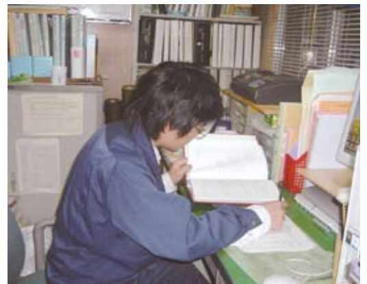
事務所での多忙な1日