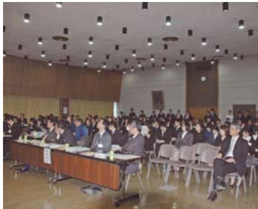
熱気あふれる発表会場

課題への取組については、「国民の森林」という資産・資源(アセット)を棚卸し(ストックテイク)する気持ちで、今までに蓄積された技術の活用、日頃からの調査・研究の積み