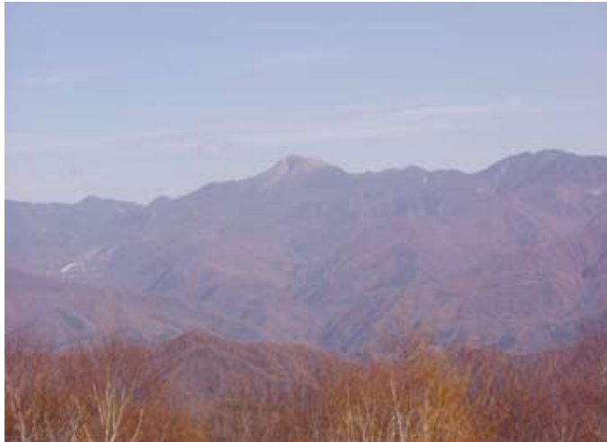
日光白根山の遠望

片品村は関東局管内の中でもスキー場が多い自治体で、村内には7箇所スキー場があり、5箇所が国有林で貸付しています。雪質も大変良いことから、毎年シーズンになると