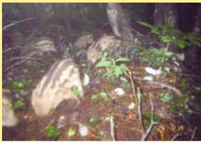
うり坊 (イノシシの子ども) も写りました