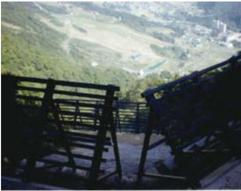
防災林造成事業 (なだれ防止柵工) 新潟県塩沢町

これは、平成14年の台風6号及び21号の集中豪雨によって多量の土石が流下し、今後の豪雨等により土石