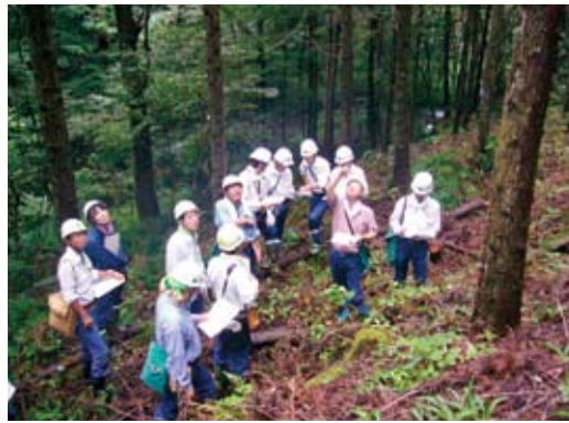
保育間伐実行箇所で光環境改善のための伐採強度の検討

9月末から10月上旬にかけて、現場第一線で「美しい森林づくり」の実行を担う、採用後2～5年の職員26名を対象として「森林の育成（造林・育林）」研修を実施しました。この研修は、次代を担う若い職員に森林の育成についての基礎的な知識や技術の定着を図ろうとするもので、その大半を、現地において保育間伐箇所の調査や除伐作業等の実習に当てました。適正な森林整備を推進す