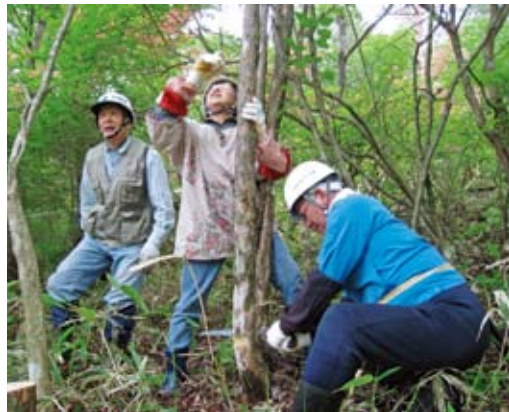
ツツジ群生地の森林整備作業

メラに収め、国有林を管理している、現在の日光森林管理署に知らせた事で、平成5年秋から奥日光一帯で鹿食害防止ネット巻き作業を行うようになり、現在も続いています。