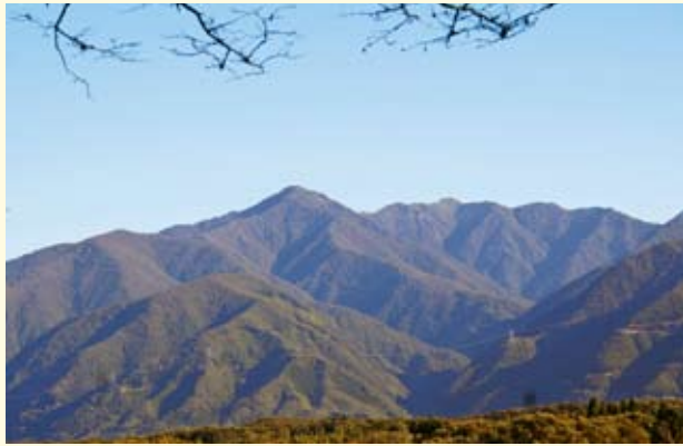
おが山塊と日留賀岳(写真中央)

栃木県塩原温泉北方の那須塩原市と日光市(鬼怒川地区)の界近くにそびえる日留賀岳(標高1,849メートル)は、福島県境の男鹿岳やこの地域最高峰の大佐飛山(標高1,908メートル)などとともに男鹿山塊といわれる山々の南端に位置しています。 あまり目立たない山ですが、静かな山を求める登山者に大変人気があります。登山口は中塩原から1.5キロほど北の白戸という集落にあり、永年日留賀岳登山の安全等に尽力いただいている民家の駐車場が起点となります。 ここからの行程は片道約3時間半の長丁場、ヒノキやカラマツなど