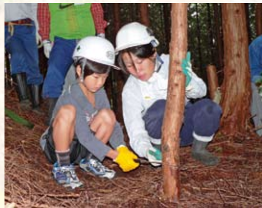
真剣に鋸を引く小学生

も森林・林業に理解が得られたもの と考えており、改めてイベントの重 要性を感じた一日でした。