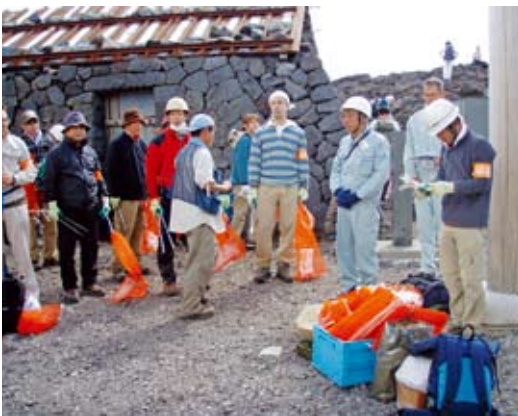
浅間大社奥宮前に集り清掃活動開始