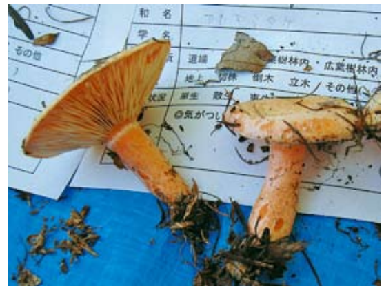
採取された「アカモミタケ」

の林を通り、途中比津羅山という小さなピークの山腹を進むと、雑木林が続く中にウダイカンバの見事な大木に出会うことが出来ます。 更に標高を上げるとアスナロの天然林が現れ、徐々に亜高山性の針葉樹林帯へと続きます。まもなく山頂と期待して登り詰めるとその奥に本当の山頂が雄大な姿を現します。 気を取り直してオオシラビソやコメツガ、ダケカンバ等の原生的な林の中を登り続け、ようやく山頂にたどり着くと、360度の大パノラマが迎えてくれます。 山頂からは、日光連山をはじめ高原山系や会津の山々、遠くは尾瀬国立公園の一角である会津駒ヶ岳