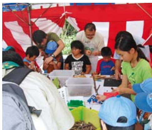
親子連れで大賑わい

当所の出展テントでは、小枝のモックンやどんぐりのトトロ人形作り等を行い、親子連れや子供たちで大変賑わいました。