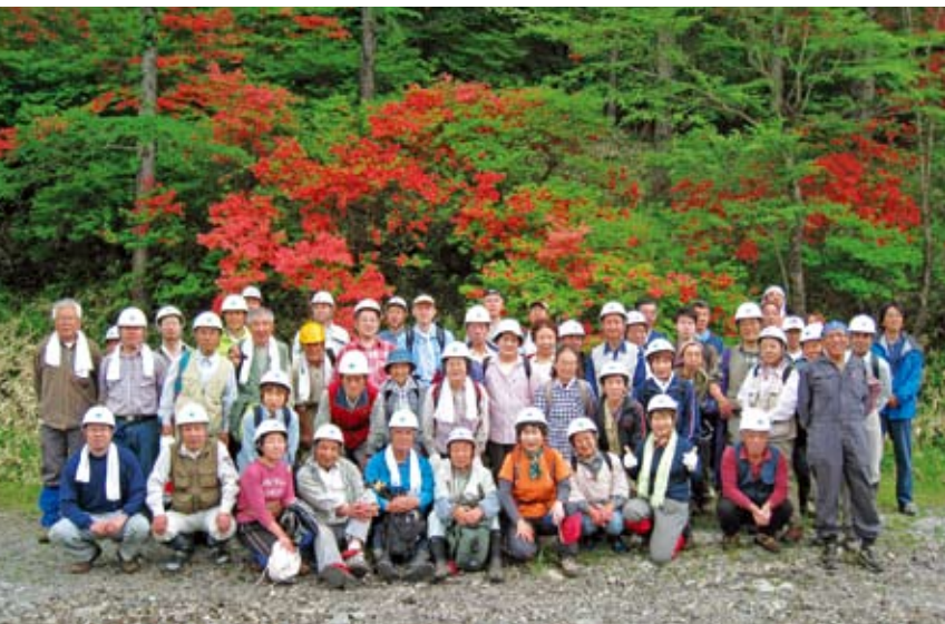
ボランティア活動に参加した皆さん

今後も、日光森林管理署の方々や多くの仲間達と共に、私達に多くの恩恵を与えてくれる森に感謝しつつ、少しずつ恩返しを続けていきたいと思っております。