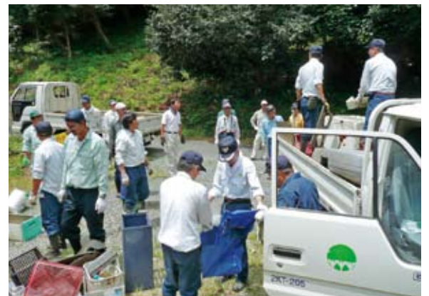
地元と連携したクリーン活動

わらず、心ない輩の行為にそれらを台無しにされてしまい、非常に心が痛みます。前述のクリーン活動をはじめ、不法投棄の防止に様々な策を講じていますが、万全とは言えず、今後も継続した活動が必要だと考えています。里山の森林では、多種多様な問題が山積していますが、地域と連携して解決していくことが、国有林として地域の活性化に繋がると考えており、今後も様々な機会を通じて、関係を深めていきたいと考えています。