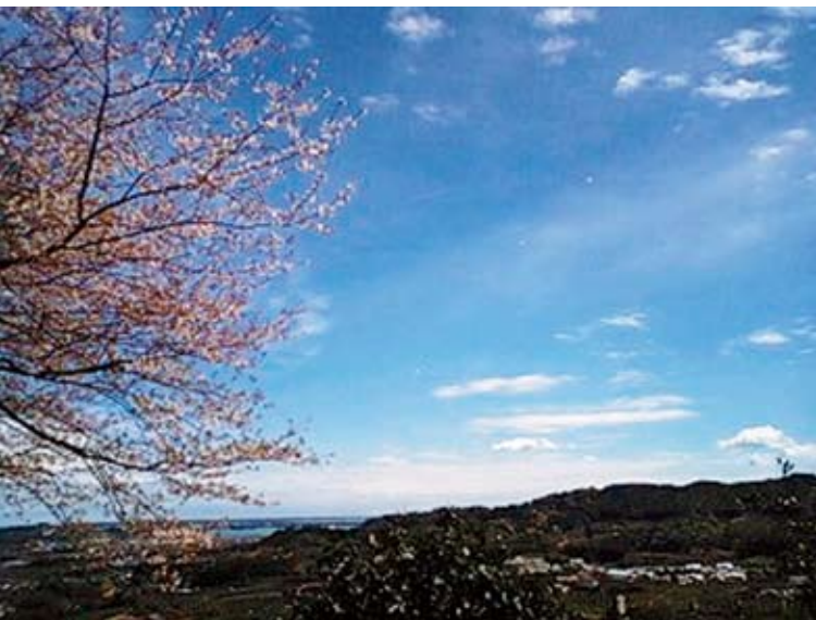
宇利峠の山桜と眺望