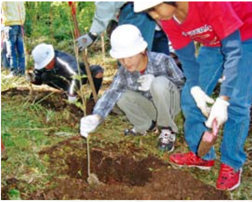
丁寧に植付をする子供たち

ここ箱根の国有林で、1973年から続いている、相模女子大小学部 の植樹は今年で36回目になります。 今年は風倒木により出来た空間に、 箱根で採取された種子の苗木である イロハモミジ、ホオノキ、ミズナラ、 ヤマボウシ、ヤマザクラ、キハダの 6種類の広葉樹60本を、生徒達が2 人1組になり持参のスコップで植え、 「地球温暖化防止に役立った」と喜ん でいました。 クラスごとに記念撮影後、森林教 室を行い地球温暖化の説明や森林の 役割について話をしたところ、生徒 達からは「根の大きさはどの位か」 「木はどの位の高さに成長するか」「何 年くらい生きていくのか」など多く の質問がありました。 箱根も朝夕はめっきり寒くなり、 これから紅葉の時期になります。