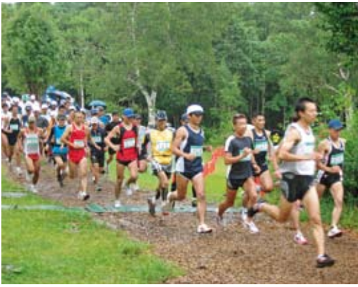
高原を駆け抜ける選手たち

このイベントは、準高所トレイルランニングの普及と森林の持つ多様な機能への関心を深めていただくために開催したもので、最短3kmから最長15kmまでの距離別ランニングや、3kmのウォーキングに合計700名のエントリーがありました。