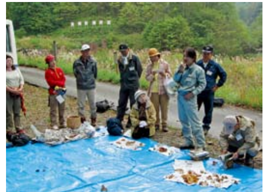
きのこについて、講師の説明を聞く参加者の皆さん

栃木県塩原温泉北方の那須塩原市と日光市(鬼怒川地区)の界近くにそびえる日留賀岳(標高1,849メートル)は、福島県境の男鹿岳やこの地域最高峰の大佐飛山(標高1,908メートル)などとともに男鹿山塊といわれる山々の南端に位置しています。 あまり目立たない山ですが、静かな山を求める登山者に大変人気があります。登山口は中塩原から1.5キロほど北の白戸という集落にあり、永年日留賀岳登山の安全等に尽力いただいている民家の駐車場が起点となります。 ここからの行程は片道約3時間半の長丁場、ヒノキやカラマツなど