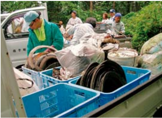
「国民の森林クリーン活動」で回収されたゴミ

約2時間の活動で集められたゴミは、ビン・カンなどの不燃ゴミが540キログラム、可燃ゴミが1110キログラムにも及び町の準備した軽トラックで処分場に運び込まれました。