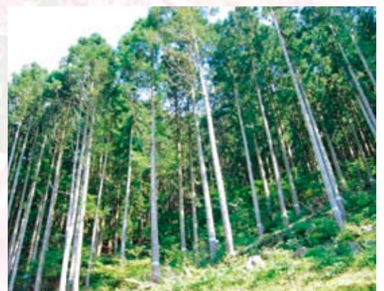
クマ対策を行ったスギ林

被害の防止については、被害の把握、防除対策の確立、自治体と協力した個体数調整等、総合的な対策が求められており、群馬県内の国有林においては、間伐等を行って林内が歩きやすくなると被害が増加する傾向にあるため、間伐等の実施に併せて、クマの嫌うビニールテープを立木に巻き付ける等の対策を実施しています。