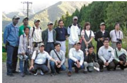
各国からの研修生の皆さん

また、法師温泉では地域と水源・温泉源である森林との関係について、説明を行いました。