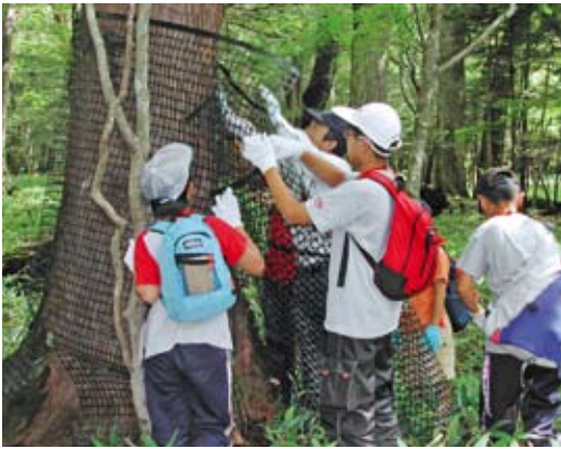
小学生によるシカネット巻き風景