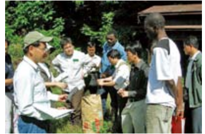
サポーター活動の説明 炭焼きには高い関心がありました

昨年に引き続き、森林技術総合研修所が実施している平成20年度海外技術研修「持続可能な森林経営の実践活動促進Ⅱ研修」の「参加型森林経営手法」の現地講義の一つとして、「いきもの村」や法師温泉においてJICA海外技術研修生に赤谷プロジェクトの取組を説明しました。