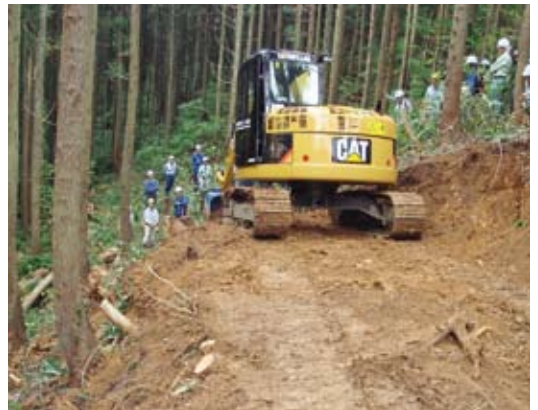
「表土ブロック積工法」の講習状況

参加者の多くは四万十式作業路網の作設を見るのが初めてで、熱心に見学されており、関心の高さと期待の大きさがうかがえました。 今回の低コスト恒久的作業路網をベースとして、今後も各地域に適した作業路網の普及と作業システムの効率化を図っていくこととしています。 (販売課)