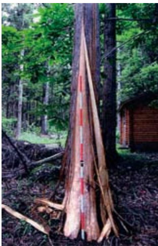
ツキノワグマによる剥皮被害

さらに、森林被害対策の面では当局管内各地の国有林において、ツキノワグマやニホンジカによる剥皮被害が大きな問題となっており、特にクマの被害については、良材が被害にあい枯損木が目立ってきています。