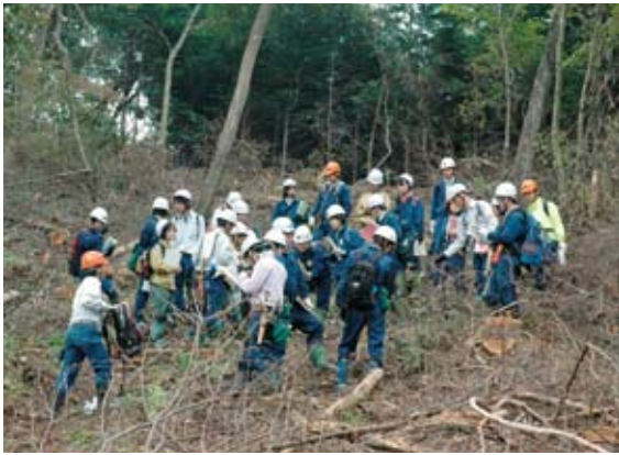
伐採跡地で天然更新樹種の発生状況の観察

森林は水資源のかん養、国土の保全や二酸化炭素の吸収・固定など地球温暖化の防止機能等、多くの公益的機能を発揮しています。このようなことから、関東森林管理局では、森林吸収源対策としての間伐実施の強化をはじめ、スギ、ヒノキ林の長期化、針広混交林化等の施策を通じて「美しい森林づくり」運動を推進しています。