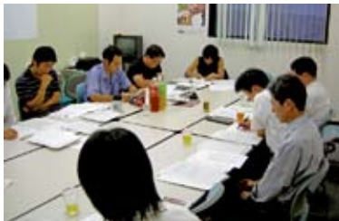
「赤谷の森」における環境教育について論議

この結果、当面は「赤谷の森」で活用できる環境教育の素材や施設を掘り起こすとともに、活動拠点である「いきもの村」の整備についても引き続き検討を進めて行くこととしました。