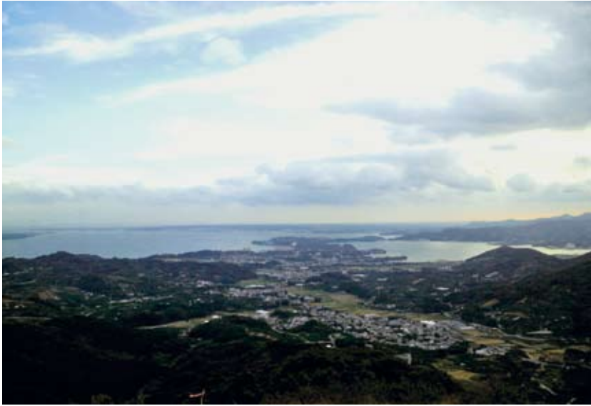
富幕山から望む浜名湖

管内は、ヒノキを中心とした人工林が7割近くを占める中、シイ等の照葉樹林が点在しています。また、国有林周辺の里山では、「みかん畑」が多く見られます。