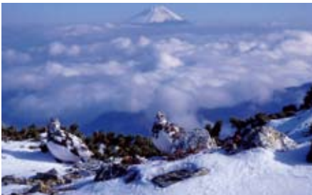
冬羽に替わった北岳のライチョウ

この3枚の写真は私が生活する広河原から北岳を望んだものです。荒廃が進む大樺沢に、コンクリートで固められた堰堤が13基入りました。この工事の時は工事車両が頻繁に出入りして、静かな広河原にブルド