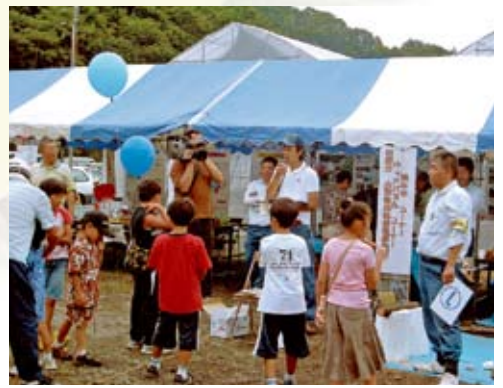
森林クイズは大人気、報道関係者も取材

今年、山梨市の「道の駅みとみ」 と「広瀬ダム」を会場にして、ボ ト乗船、土石流模型実験コーナー、 発電実験模型の展示・体験などのほ か、「じよいそーらん山梨県大会」も 併せて開催され、県内外から大勢の 人が訪れました。