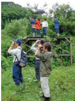
猛禽類調査の実習の様子