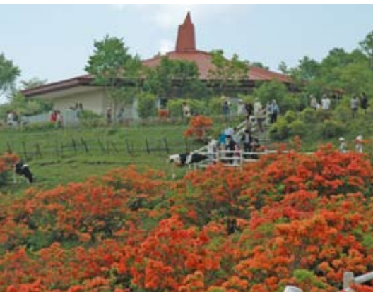
レンゲツツジが満開の赤城白樺牧場

これだけの広い山系が自分に任されているのだと思うと身の引き締まる思いがしますが、少しでも任せられた森林を良い方向に導くために「日々これ勉強」と思いながら山に向かう毎日です。