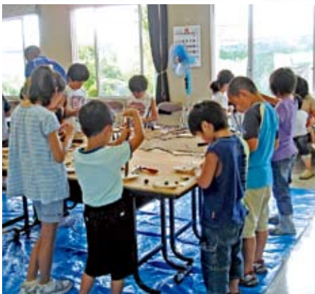
作品作りに励む子どもたち