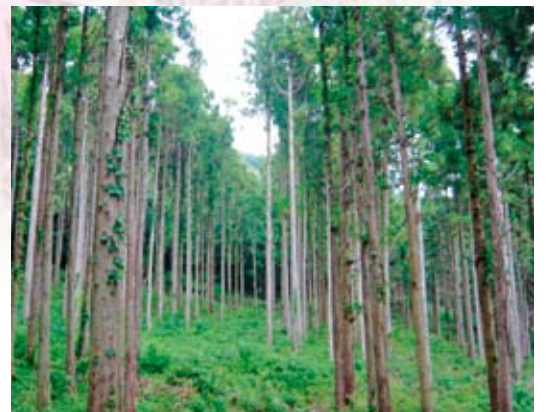
列状間伐実施箇所

伐の実施箇所では、景観に配慮して等高線上に列を設定していましたが、残列における密度調整の必要性や選木の考え方について論議が展開されるなど、これからの施業にふさわしい伐採方法や管理の方向性について、職員一同があらためて考える意見交換会となりました。