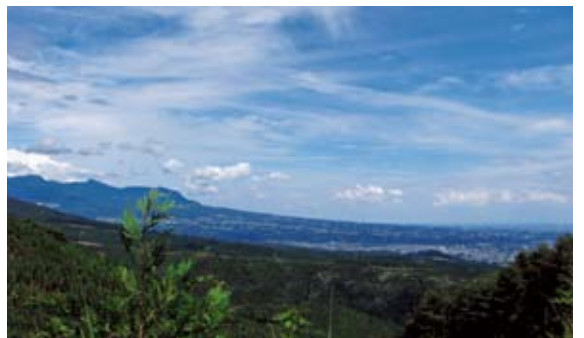
伸びやかな赤城山の裾野

市、関東森林管理局が共同で森林整備に取り組み「あかぎ親しみの森」があり、毎年2回の森林整備が行われています。平成10年の活動開始以来、今や参加ボランティアが増え、6つに増え、多くの人が森林整備を通して森林とのふれあいを楽しむ場となっています。 森林官としての業務は、春の植付からはじまり、造林請負関係の業務が夏まで続き、秋が近づけば来年度事業のための踏査や収穫調査が加わり、報告書類の作成に追われるうち、あつという間に冬になってしまいます。 その後も管理関係や、調査書類の残りを作成していると1年が終わるといった感じで、なかなか気の休まることがありません。 特に、1年目は年間の仕事の流れが読めず、色々と苦労することもありました。 近隣事務所との距離も離れているため先輩森林官と仕事を共にする機会は少なく、現場にはもっぱら基幹