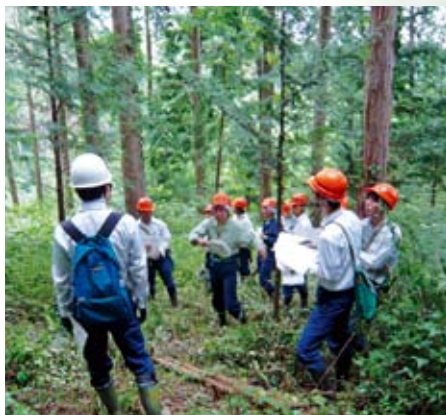
複層林施業実施箇所にて論議