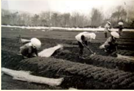
残雪期の苗木選別作業