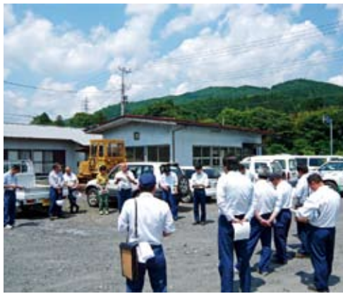
現地出発前の打合せ

こうした考えに基づき、関東森林管理局計画課では、長伐期化等に対応した間伐等のあり方に関する意見交換会を、茨城・天竜 両森林管理署管内の国有林で開催しました。