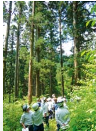
樹冠の水平方向への成長を目測