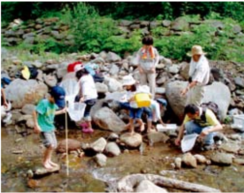
夢中になって水生生物を探す子どもたち