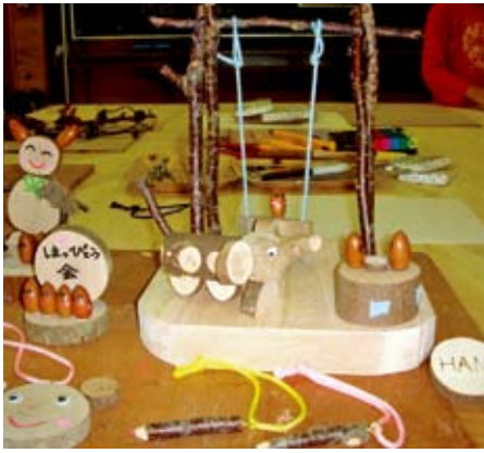
色々な作品ができました

子供達には紙芝居、大人の方達にはビデオを使って森林の働きを紹介し、木工の基本と道具の説明をした後、輪切りにした木・小枝・木の実等を使って、自由に工作してもらい