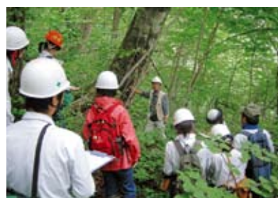
ブナの倒木更新について解説

今後、この研修で学んだことを活かして、森林生態系全体を考えながら森林施業に取り組んで頂ければと思います。