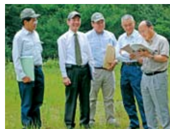
赤沢スキー場で赤谷プロジェクトが生まれた経緯について説明

今後このような機会を捉え、各方面に赤谷プロジェクトの意義を伝えていきたいと考えております。