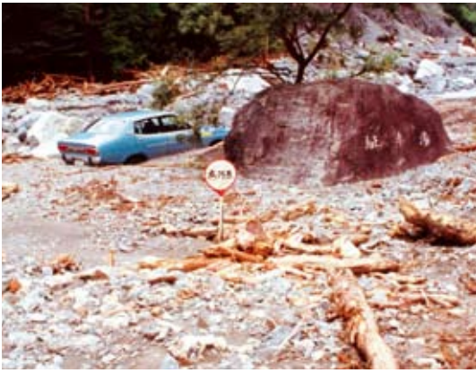
昭和57年災害時の広河原

南アルプスの北部は本邦第二の標高を誇る北岳を擁する白峰三山、花崗岩の甲斐駒ヶ岳と鳳凰三山、南アルプスの女王と呼ばれ、遠く赤石岳に続く尾根を張っている仙丈ヶ岳からなり、全山ブナやウラジロモミ、ツガ、シラビソ、トウヒ等からなる見事な原生林に覆われ、感動的な景観を誇る3,000mの稜線にはライチョウが遊び、可憐な花達が咲き誇り、刻み込まれた美しい渓谷は清冽な水が時には滝を落としながら流れ下る、日本山岳の原風景がそこにあります。