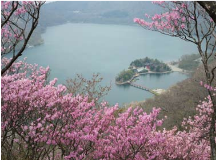
ヤシオツツジ咲く黒檜山登山道から大沼を見下ろす

人の姿が数多く見られ、秋には紅葉が美しく、冬には湖面が氷結しワカサギ釣りのテントが立ち並ぶといったように、四季を通じて観光客が絶えません。