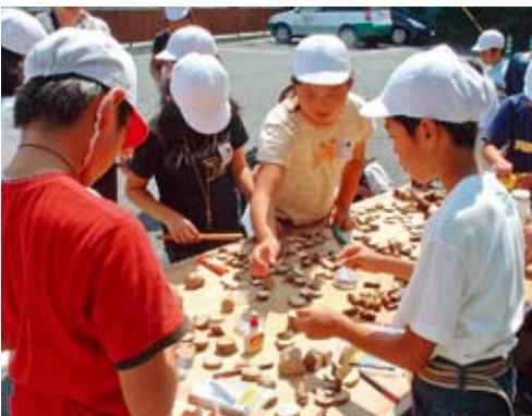
真剣に「モックン」作りをする子供たち

地球温暖化防止等に果たす森林の 役割や木の温もりについての理解を 深めてもらえた一日となりました。