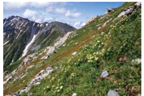
キタダケソウと間の岳

一人もいません。もし工事進行中に完成後の景観予想図があったとして、自然の中にブルドザーがいなくても素朴な自然保護者に、工事の効果を説得するのは難しいかもしれません。なぜなら、自然を傷つけることは、