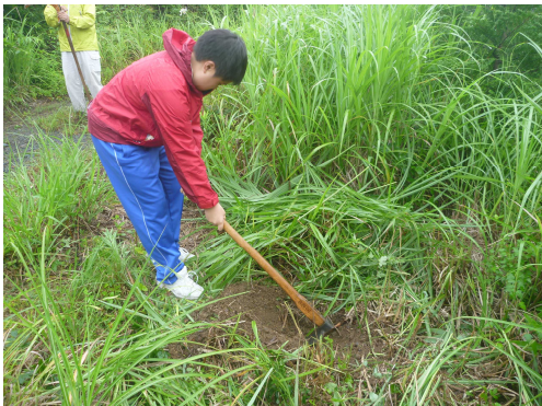
苗木を植える穴を掘ります。意外と大変!