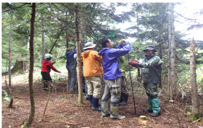
防鹿柵設置の様子

尾瀬サミットは、平成7年以降、尾瀬保護財団理事長である群馬県知事、同副理事長の福島県知事及び新潟県知事をはじめ、尾瀬の関係者が一堂に会し、尾瀬の自然保護や適正利用等に係る施策を一層推進するため、毎年開催されており、本年は9月10日（月）～11日（火）の2日間、福島県檜枝岐村の尾瀬沼湖畔にある尾瀬沼ヒュッテにおいて開催されました。