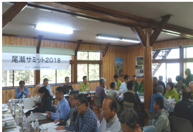
尾瀬サミットの様子

また、尾瀬が単独で国立公園として指定される前年の平成18年に、尾瀬に関わる地元関係者、学識経験者、自然保護関係者、関東森林管理局を