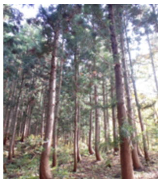
共同施行団地の間伐状況

私は4月に赴任してきたばかりですが、現場の最前線にいる森林官として、先人により手入れされてきた森林を、より良く・身近に感じてもらえる森づくりを目指し、民有林関係者の皆さんと連携して、邁進してまいります。