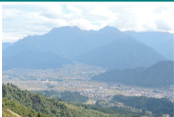
南魚沼盆地と八海山

私の勤務している六日町森林事務所は、新潟県南部の南魚沼市に所在し、群馬県境をなす三国山脈沿いの国有林約一万八千七百haを管理しています。南魚沼市は、中央に魚野川が流れる魚沼盆地にあり、全国的にも高い評価を受けている魚沼産コシヒカリを中心とした農業を振興、冬季は市街地でも積雪が2mを超える全国有数の豪雪地帯で、スキー場を多数有しウィンタースポーツの盛んな市でもあります。その他、今年9月に南魚沼市を含む3県7市町村をつなぐ全長約307kmのスノーカントリールート(雪国観光圏域内を巡るロングトレイル)がオープンし、多くの人が訪れるのが期待されているところです。