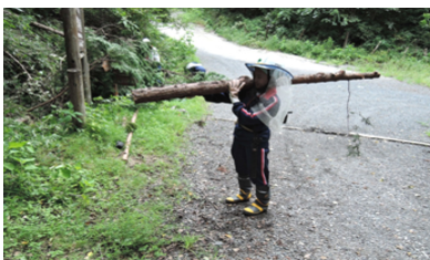
職場体験：間伐作業

8月29日に江東区立深川第二中学校2年生2名、8月30日に江東区立深川第八中学校2年生2名、9月5日〜7日の3日間に八王子市立横山中学校2年生3名の生徒が職場体験にやってきました。下刈作業、間伐作業、炭焼施設の整備、風倒木処理の手伝い、森林観察方法を体験しました。この職場体験を通じて、仕事の大変さを感じた一方で、森林・林業の大切さ、自然環境維持の難しさや楽しさも感じてくれたようです。