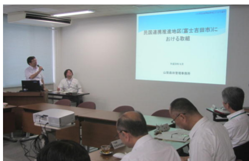
各署等から取組状況報告

各署等から取組状況報告 平成30年度において、森林管理局、加し、官等が技術指導の森地方の職員の