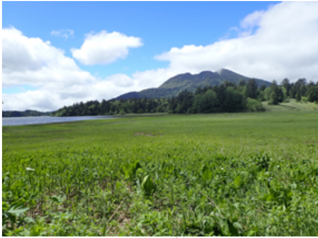
尾瀬の風景 (燧ヶ岳)

このうち、尾瀬地域の北側を、奥会津森林生態系保護地域と利根川源流部・燧ヶ岳周辺森林生態系保護地域に指定し、自然維持を重視した管理を行っています。