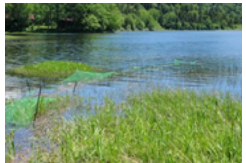
防鹿ネットによる水際対策