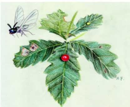
ナラヒロタマルタマフシ(樟葉早丸玉附子) クマバチの一種がナラ類の葉に産卵して産む虫こぶ。 夏〜秋にかけて赤く色づき、翌春に羽化した成虫が出る。

そのため、管内の人工林は全体の約4%と面積は少ないですが、平成27年から南魚沼市・南魚沼森林組合・株式会社戸田組と当署で「南魚沼市山口地域森林整備推進協定」を結び周辺民有林と協力し路網等の基盤整備や施業の集約化により、計画的・効率的な木材生産、森林整備が図れるよう取組を行っています。また、管内の森林施業にあたっては、イヌワシ等の希少猛禽類の生息環境の維持向上を図るため、「中越森林管理署におけるイヌワシ