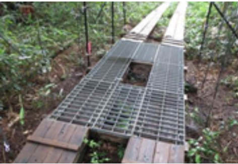
木道上のグレーチング設置

そのような中、平成20年頃からニホンジカによる食害によりニッコウキスゲの開花数が大きく減少しました。