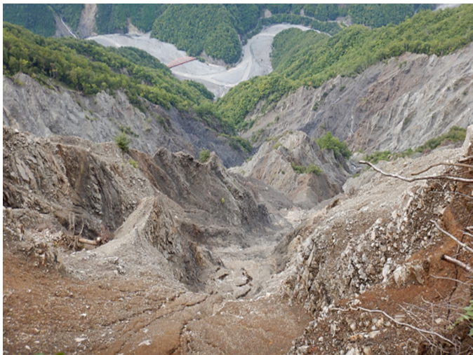
「赤崩（あかくずれ）」（静岡県静岡市葵区）