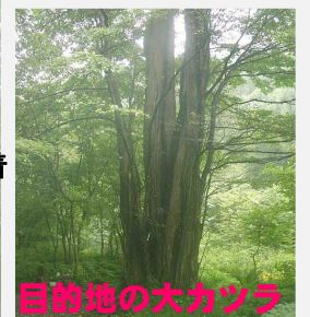
目的地の大カツラ