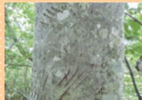
ツキノワグマの爪痕