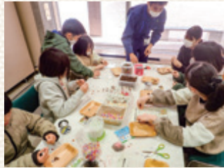
▲ 図1: ヒノキの球果ストラップ作り