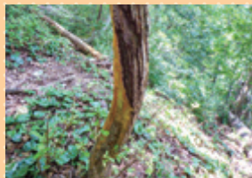
ニホンジカの角研ぎ跡