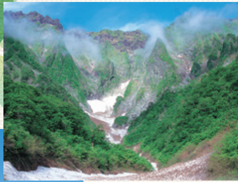
▲ 図3-2: ノノ倉沢