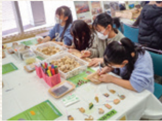
▲ 図2: 森のかけらストラップ作り