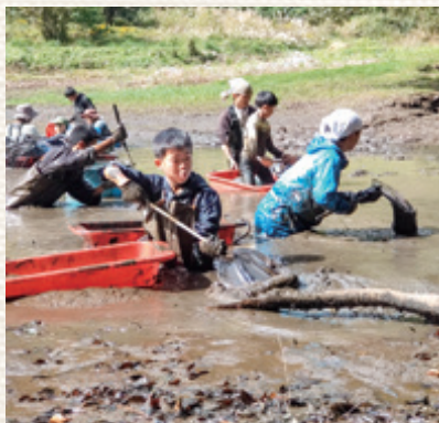
▶ 図4: ネイチャーポジティブPRRの中で行われた「かいぼり」イベントの様子

的な農林業を行うといったものを生態系の保全と重ねていかなければネイチャーポジティブは実現しないとされています。生物多様性の復元を持続可能な地域づくりとセットで行うこの取組は、赤谷プロジェクトと合致するものだと思うっており、このような背景があったために今回の協定に至りました。 人工林を自然林に戻すためには、伐採した材を地域の資源として活用しなければネイチャーポジティブにはなりません。里地里山の保全についても、里山地域の農産物を高付加価値で売っていくようなことを目指す必要があります。低密度下でのシカの捕獲についてもそれをジビエ利用し、地域経済に使っていくことが課題とされています。このような目標を達成していくために皆様には引き続き協力いただければと思います。ぜひ、みなかみネイチャーポジティブプロジェクト/赤谷プロジェクトにご参加ください。