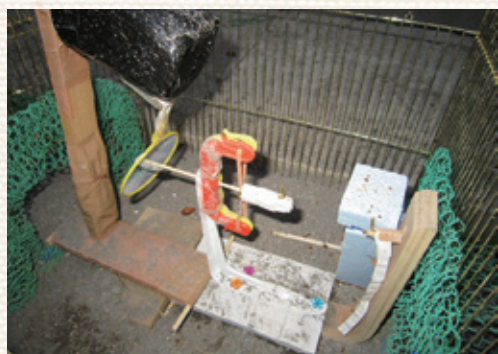
写真2: 弓矢を発射して餌が落ちた