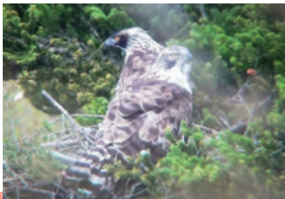
▲クマタカHペア2023年5月 新たな雌(手前右側)と雄