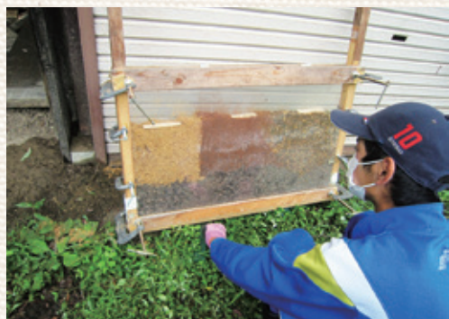
写真3: 平面水槽で巣穴を作らせる