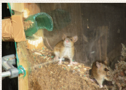
写真4: アカネズミの貯食を可視化する

月後「目印」のある地面からドングリを掘り返して食べるのだ。そんなに記憶力がいいのか。「目印の図形」が識別できるのか「謎」だった。そこで「頭の良さ」を確かめる様々な学習実験を行った。最も複雑なのは『アーモンド・トリガー(弓矢発射学習実験)』である。最初黒いペットボトルに餌を入れて「黄色い金魚すくい」を下に引くと「切れ込み」から餌が落ちるようにしてアカネズミのカゴに入れたが全く反応しなかった(餌があると学習してないから)。次に「金属ボルトの弓矢」を引き絞って「穴を開けたアーモンド(引き金)」で固定した。アカネズミが「穴を開けたアーモンド」を食べると自動的に弓矢が発射され「黄色い金魚すくい」に当たり、餌が落下