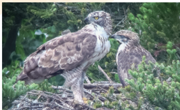
▲クマタカHペア2023年7月 新たな雌(左側)と巣立ち間際の雛

クマタカHペアでは、今年、雌個体が入替わり、若い個体となり、新たなペアによる子育てが順調に行われました。去年までペアを組んでいた雌は、推定25歳以上で、1999~2023年の間に7羽のヒナを巣立たせました。クマタカSペアでは、既に雄が入替わっており、クマタカKペアでは、2020年に抱卵途中で繁殖中断となった後、2021年以降、繁殖時期になると、巣周辺で、性別不明の成鳥、若い雌、若い雄と複数の個体を観察していますが、ペアの形成には至っていません。赤谷の森と周辺地域では、クマタカ4ペアが個体を入れ替わつつ、継続的に繁殖することが出来る環境が維持されています。