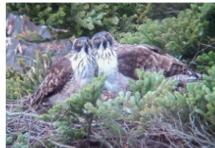
▲クマタカHペア2019年 以前の雌(右側)と雄