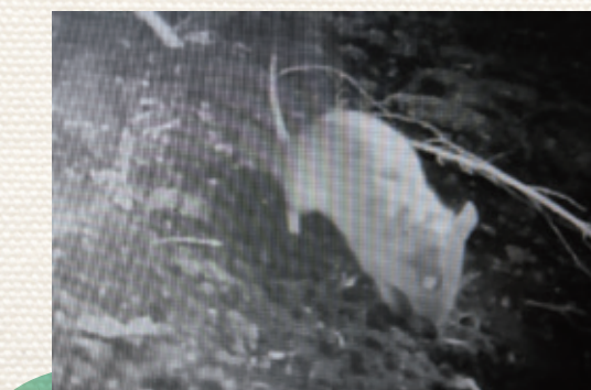
写真5: 土中に埋めたトリュフを掘る

菌根菌のキノコ(マツタケやトリュフなど)と共生しないと成長できない。という知識を得た。キノコを食べたアカネズミなどの色々な動物が「フン」として胞子を森にばら撒いて(胞子散布という)菌根菌と共生できた樹が育つのだという。さっそくアカネズミの巣穴のそばに「黒トリュフ」を埋めてセンサーカメラをセットしたら、黒トリュフを掘り出して食べるアカネズミが映っていた(写真5)。