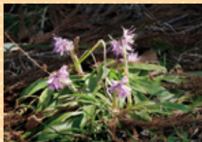
ショウジョウバカマ(4月下旬)