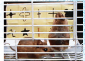
写真5. 十字を破くアカネズミ