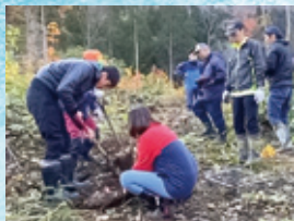
写真1. ミズナラの苗を植樹