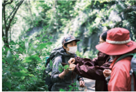
写真 左:一ノ倉沢をガイド 右:植物を解説