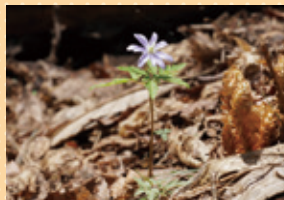
キクザキイチゲ(4月下旬)