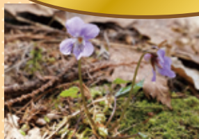
タチツボスミレ(4月下旬)