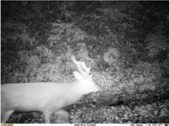
写真1: センサーカメラで撮影された林道を歩くニホンジカ

しかし今、ニホンジカの増加によって生物多様性が損なわれようとしています。ニホンジカが植物を食べることにより、樹木や植物が失われます。すると山の保水能力が無くなり、土が川に流れ、濁っていきます。つまり、生活用水としての水が汚染されると言うことです。同時に他の動物の食料やすみかの減少にもつながっていきます。このことからニホンジカの管理をしていくことが必要だと分かりました。赤谷プロジェクトでは、ニホンジカの低密度管理を行っています。頭数管理ではなく、順応的管理の考え方を基に管理を行っています。しかしニホンジカの頭数を減らすに当たって、捕らえた個体を活用できていないという課題があります。そこで私たちは処分されるしかなかったニホンジカの、有効な活用方法を考えました。