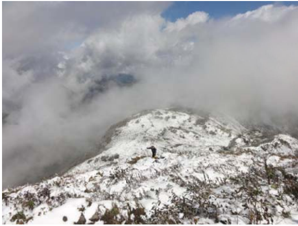
雨飾山山頂から新潟県側登山ルートを望む