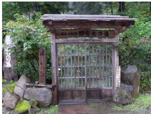
新潟県側の「秘湯」 「都忘れの湯」

「雨飾山（標高1,963㍎）」は、上信越高原国立公園の西端に位置し、新潟県糸魚川市と長野県北安曇郡小谷村との県境に位置する頸城連峰の一つです。