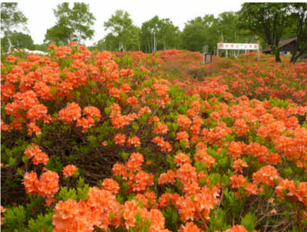
武尊牧場三合平のレンゲツツジ

武尊山山麓は、そのほとんどが国有林となっており、北麓は武尊自然休養林として約1,400haのブナ、シラカンバなどの広葉樹林が優れた自然景観を呈し、西麓及び東麓にはキャンプ場やスキー場が数多く設けられているなど、四季を通じて地元住民はもとより首都圏からの利用者が訪れています。