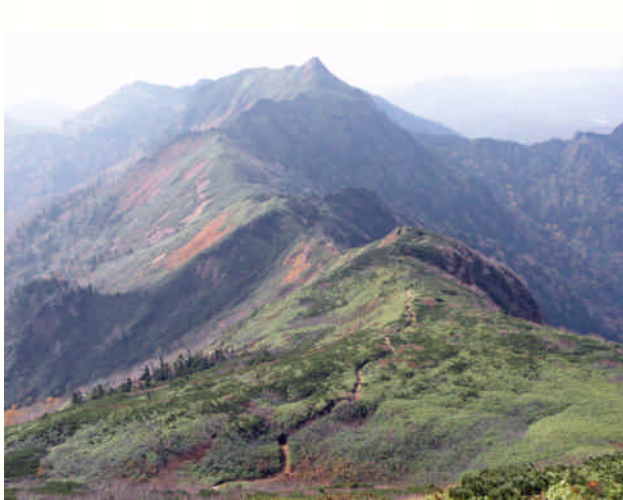
家の串方面から望む武尊山(群馬県片品村)