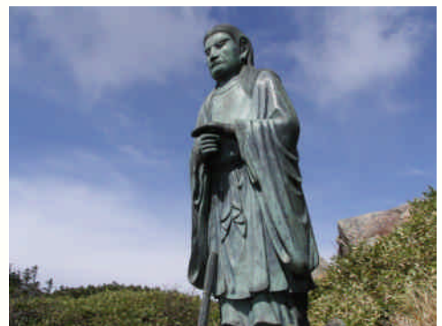
日本武尊(やまとたけるのみこと)像

特に、武尊牧場コースは、6月中旬から下旬にかけて群馬県の天然記念物に指定されている15,000株のレンゲツツジの大群落が咲き誇り、多くの登山者を楽しませてくれます。