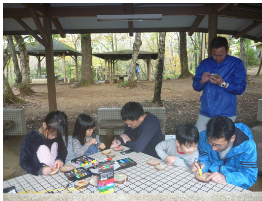
輪切りにした丸太に、お父さんと一緒にお絵かき中(〇〇)

森林整備班は、作業の説明を受け、3班に分かれて作業を開始しました。参加者からは「大変だけど楽しい」「いい運動になった」といった声が聞かれました。また、参加者の中には作業をしているうちに暑くなり上着を脱ぐ人もいるほど、真剣に取り組んでいただきました。 木工班では、丸太切り、コースター・もつくん(キーホルダー)作りを親子3組で行いました。参加した子ども達からは「楽しい!!」「もう一回やる!!」といった元気な声が聞かれ、楽しみながら取り組んでくれました。