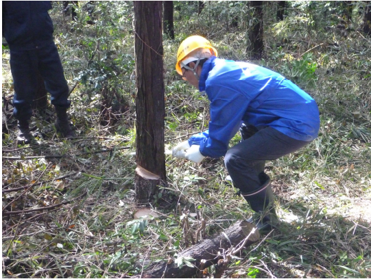
きれいに倒れるかな?

11月12日、笠間市の北山国有林にある法人の森林「茨城水源の森」において、アサヒビール(株)茨城工場の社員とその家族約50名が、森林整備(間伐)班とコースター作りなどを行う木工班に分かれ作業を行いました。 当日は、前日降った雨の影響も無く、木漏れ日がまぶしく感じられる絶好の作業日和となりました。