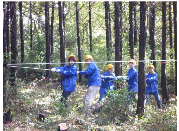
力を合わせて「せーの!」

森林整備班は、作業の説明を受け、3班に分かれて作業を開始しました。参加者からは「大変だけど楽しい」「いい運動になった」といった声が聞かれました。また、参加者の中には作業をしているうちに暑くなり上着を脱ぐ人もいるほど、真剣に取り組んでいただきました。 木工班では、丸太切り、コースター・もつくん(キーホルダー)作りを親子3組で行いました。参加した子ども達からは「楽しい!!」「もう一回やる!!」といった元気な声が聞かれ、楽しみながら取り組んでくれました。