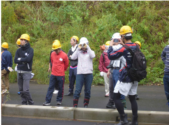
高さはどのくらいかな?