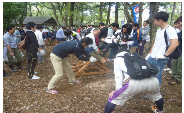
結果次第で豪華食材・・・

また、森林教室ではクイズを交えながら「森林のはたらき」「生物多様性」についてお話をいただきました。その後、BBQの豪華食材をかけて丸太切り競争を行いました。ノコギリの刃が折れる! 曲がる! などのハプニングがあったものの、皆さん楽しみながらも真剣に取り組んでいました。